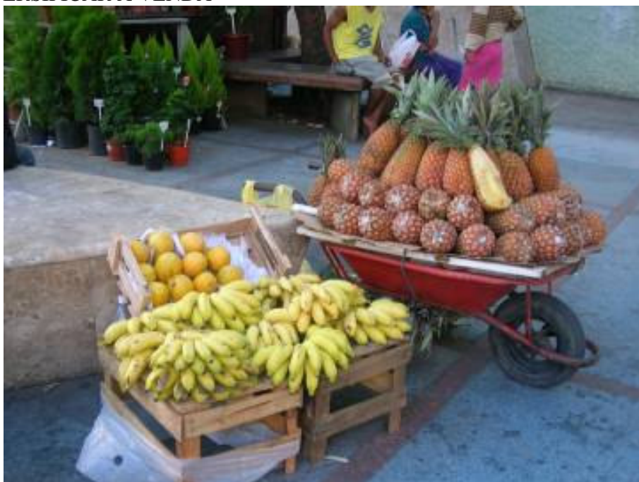
FOTO 6 – COMBINAÇÃO DE OUTROS FRUTOS COM O ABACAXI PARA DIVERSIFICAR A VENDA

Uma distinção importante é a que existe entre os jovens que são de famílias produtoras de abacaxi e que tem acesso a terra e os que não vem de família que tem acesso a terra, mas sim de famílias que tem outra ocupação principal ou até mesmo não tem ocupação. Essa diferença baliza a possibilidade de trabalhar na venda durante a safra do abacaxi ou não e, conseqüentemente, ao desejo e as possibilidades de permanência “na roça” e trabalhar na terra, como se mostra adiante. Os vendedores procuram obter rendimentos maiores para garantir um futuro e, com isso, o que parece estar ocorrendo, também, é a opção pela diversificação dos frutos postos à venda para aumentar a atratividade e, conseqüentemente, o ganho nos carrinhos (ver Foto 6).