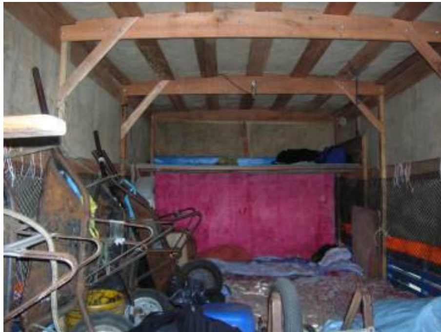
FOTO 9 – INTERIOR DA CARROCERIA DE UM CAMINHÃO, ONDE OS JOVENS COSTUMAM VIAJAR E DORMIR

para percorrer conversando em voz alta, muitas vezes, as mesmas ruas que percorreu calado durante o dia.