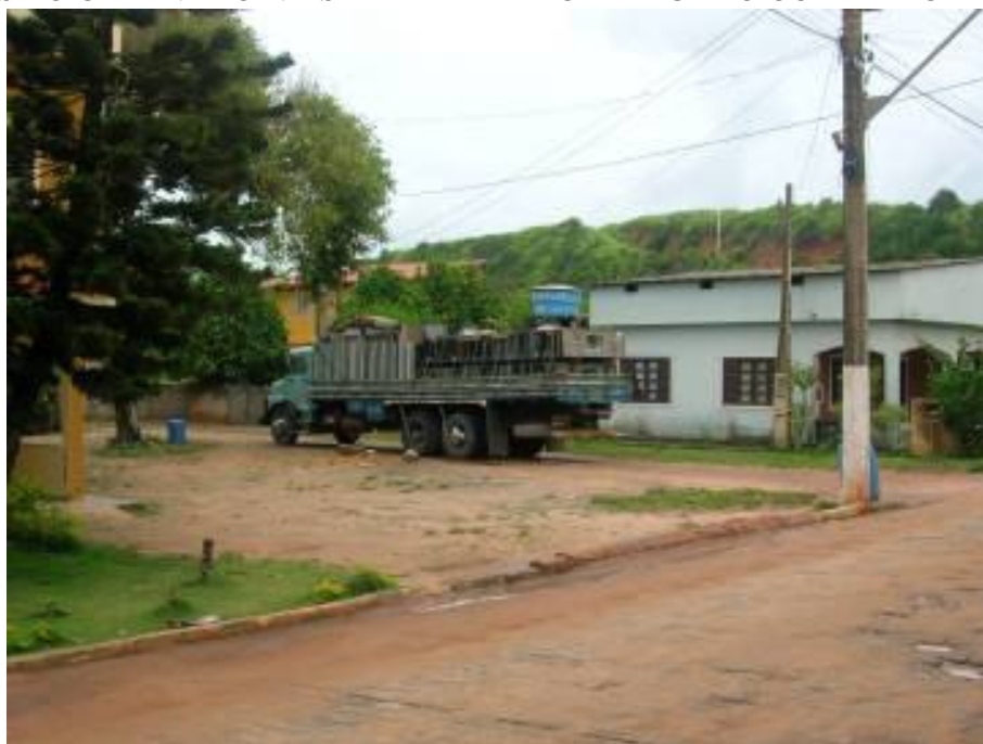
FOTO 8 – CAMINHÃO EM MARATAIZES, CARREGADO DE PIAS DE PEDRA. O MESMO CAMINHÃO NA SAFRA ALTA É CARREGADO COM ABACAXIS