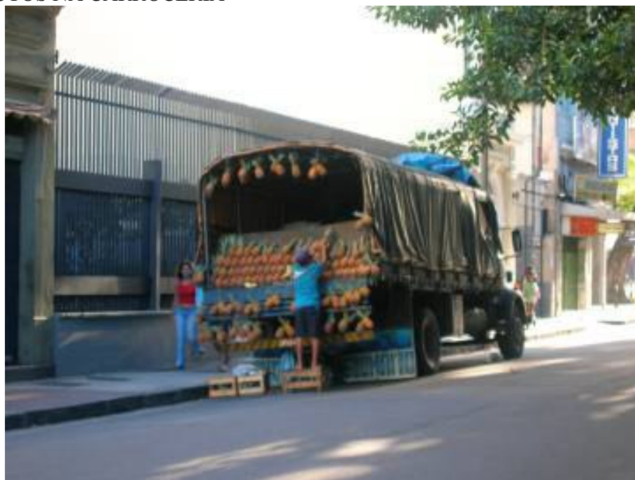
FOTO 1 – CAMINHÃO NO LARGO DO MACHADO COM JOVEM ARRUMANDO OS FRUTOS NA CARROCERIA

Na segunda quinzena de agosto do ano de 2004, instigado pela curiosidade e carregado de dúvidas, busquei aproximação com uma das novas figuras que considerei representativas da ruralidade nas ruas da “cidade grande” 5 . Na paisagem da rua, os frutos, colorindo o cinza da cidade, prontamente saltaram-me à vista. Mirando longe, dirigi-me aos caminhões que costumam ficar estacionados no caminho para o bairro de Laranjeiras, logo após o Largo do Machado (zona sul da cidade) (ver Foto 1).