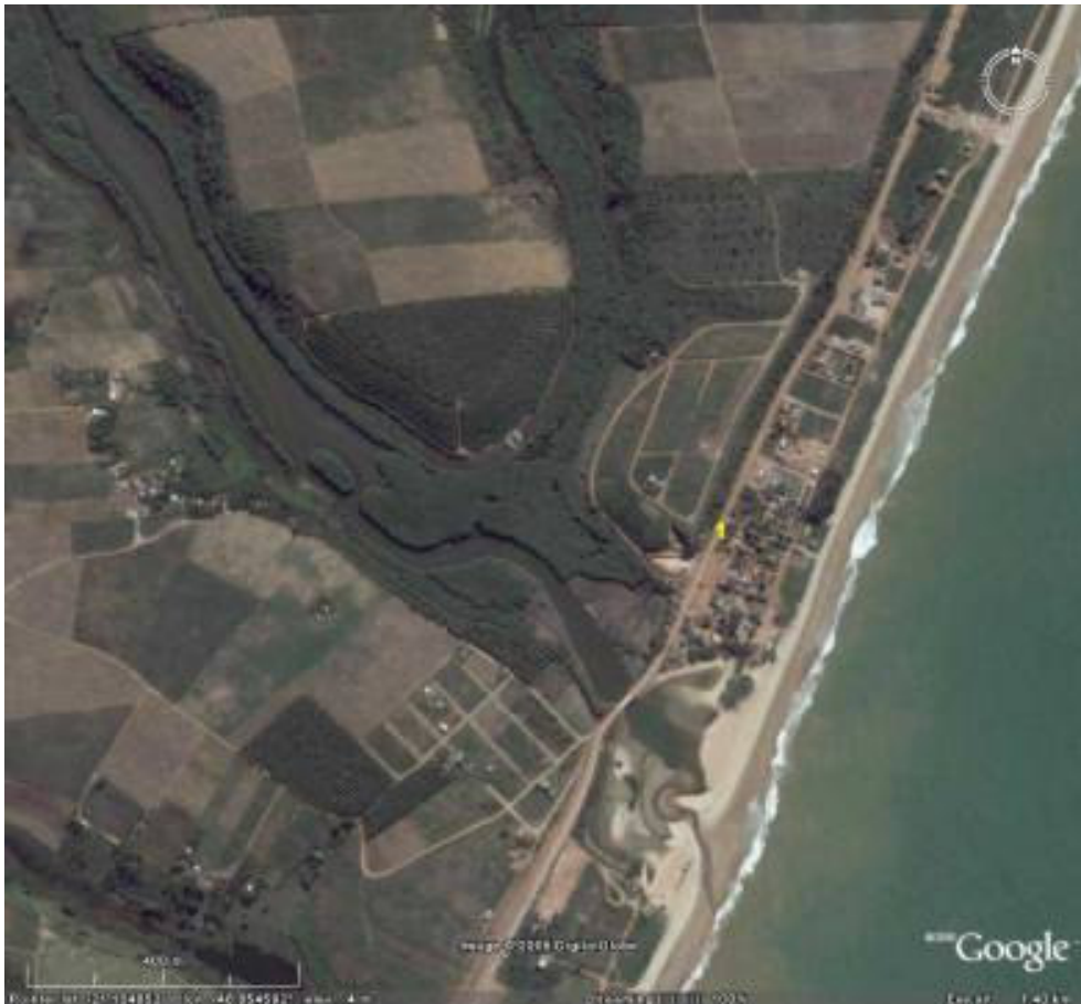
FOTO 18 - LAGOA DO SIRI