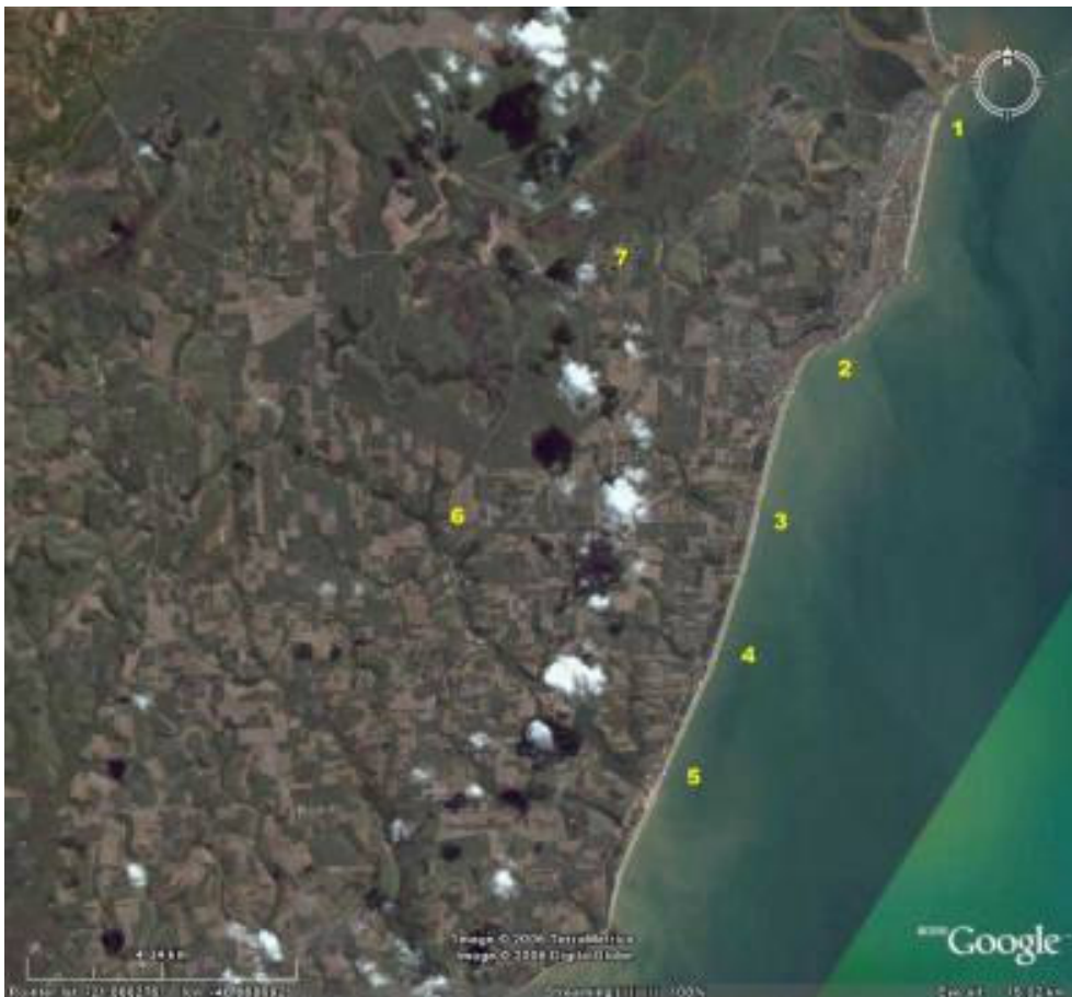
FOTO 10 - MUNICÍPIO DE MARATAIZES

O Porto da Barra do Itapemirim, limite norte do município (ver Foto 10), foi a principal entrada de imigrantes portugueses, italianos, franceses, libaneses e holandeses que se instalaram e colonizaram o sul do Espírito Santo, entre 1876 e 1930, e também principal escoadouro de produtos agrícolas, madeiras e minerais trazidos por tropeiros até o litoral, oriundos do interior e de Minas Gerais e levados para a corte no Rio de Janeiro e Bahia no período imperial.