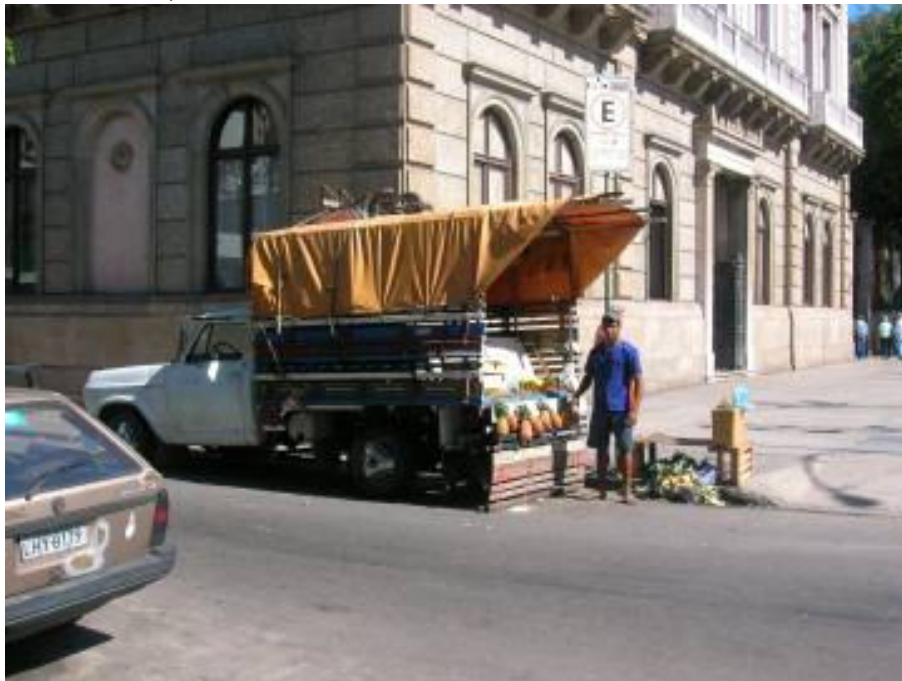
FOTO 7 – CAMINHÃO DE MENOR PORTE, ESTACIONADO AO LADO DO MUSEU DA REPÚBLICA, NO CATETE.