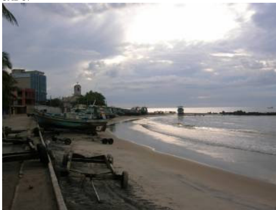
FOTO 11 – PORTO CENTRAL, AONDE CHEGAM OS BARCOS CARREGADOS DE PESCADO.

Sua economia é baseada na pesca (ver Foto 11), nas produções de abacaxi e cana-de-açúcar, pequenas culturas (mandioca, maracujá, etc...) e no turismo, com grande tendência de crescimento e, muito em breve, na extração de petróleo, pois foi confirmada a existência em toda extensão costeira do município. O processo de ocupação turística do litoral sul do Espírito Santo avançou na década de 1950. Motivados principalmente pelas características de sua costa recortada, que propicia a formação de enseadas de águas claras e calmas e a presença de areias monazíticas, os primeiros fluxos turísticos se dirigiram às praias Areia Preta e Castanheiras, no município de Guarapari, e a praia da Vila de Marataizes, hoje sede do município de mesmo nome. Marataizes, antes uma pequena vila de pescadores, tornava-se um destino turístico procurado principalmente por moradores de Cachoeiro do Itapemirim, a principal cidade do sul do Estado naquele período.