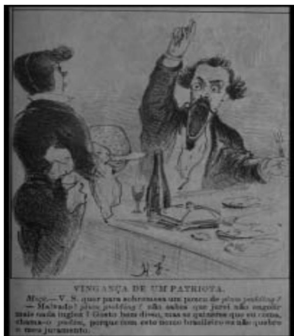
Figura 7: Charge da Semana Illustrada

Levando-se em conta a grande influência inglesa na Corte, não é surpresa que vários contos, romances e peças teatrais contem com personagens ingleses. Não seria justo afirmar que a presença desses personagens tenha como única explicação extravasar a anglofobia contra a potência europeia ou demonstrar uma devotada anglofilia. Mas essas obras são uma grande fonte para identificar a maneira que os ingleses eram vistos, pelo menos por uma parcela da população brasileira.