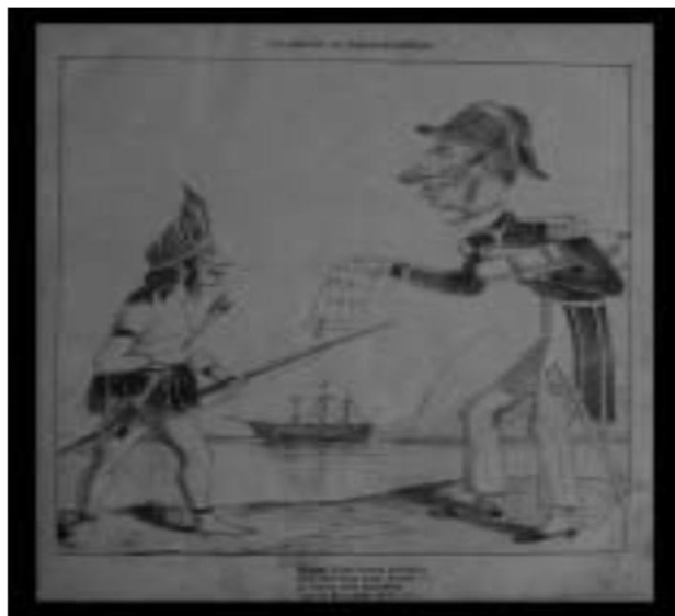
Figura 3: Charge da Semana Illustrada

“no primeiro plano, perna estendida de marinheiro inglês, com diminutas flechas, sobre território brasileiro. O marinheiro inglês está representado por uma figura híbrida, corpo humano e cabeça de leão, animal emblemático de identidade da nação britânica. As flechas, por sua vez, simbolizam a nação brasileira, armas dos índios, que representados em proporções diminutas em relação à gigantesca figura leonina, representativa da nação britânica, que foi atingida ao ousar estender o seu domínio aquele território do outro lado do Atlântico, habitado por valentes guerreiros.” 147