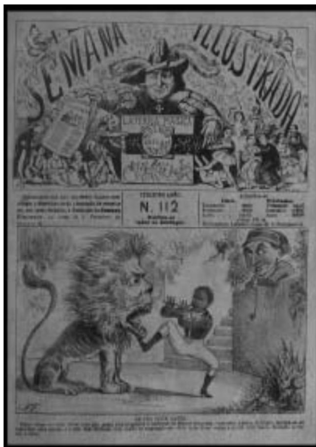
Figura 5: Charge da Semana Illustrada

que da mesma maneira “que o imperador e seu governo podem contar com a força do povo, o povo pode contar com o seu monarca”.