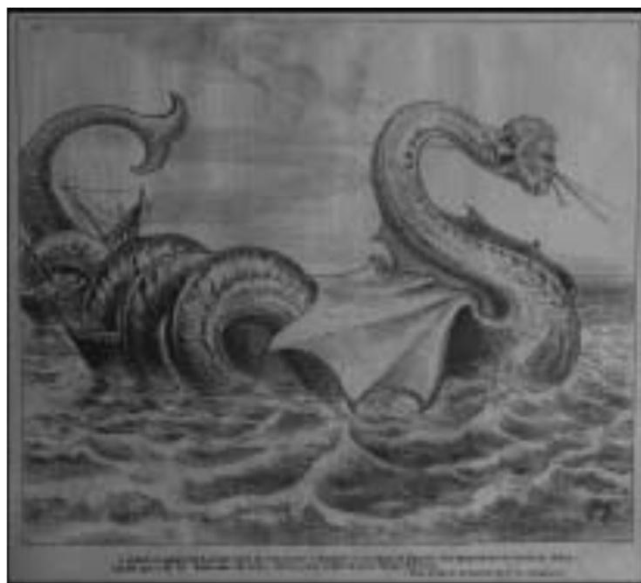
Figura 8: Charge da Semana Illustrada

O estereótipo do inglês como um indivíduo frio, arrogante e ganancioso, perpassa grande parte desse universo de personagens ficcionais. Isso não quer dizer que os ingleses cumpriam sempre o papel de vilão ou antagonista, apesar de ser importante salientar que tais papéis durante o auge do movimento romântico nas décadas de 1850 e 1860 tenham sido preenchidos por personagens estrangeiros. Mesmo quando a imagem do inglês não era completamente negativa, os personagens eram marcados por certas características em comum, como excesso de pompa e certa soberba, com poucas exceções.