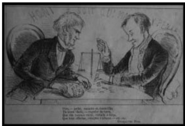
Figura 8: Charge da Semana Illustrada

Ouro – poder, encanto de maravilha. Da nossa idade, -regador da terra, Que dás honra e valor, virtude e força, Que tens ofertas, ablações e altares 188