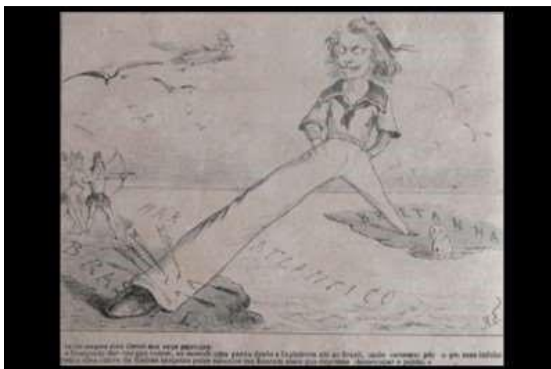
Figura 4: Charge da Semana Illustrada

lançadas pelos caboclos Me fizeram mais que depressa desocupar o ponto. 148