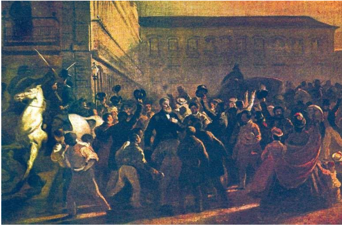
Figura 1: Pintura de Vitor Meireles – D. Pedro no Paço

Ainda no dia 3 de janeiro, reuniram-se para traçar uma nota que fosse aceitável para ambas as partes. Christie tinha boas relações com o barão de Mauá e relações cordiais com Abrantes e provavelmente o clima hostil convenceu o inglês da importância de um rápido desfecho. O secretário particular de Abrantes e Christie trabalharam na elaboração de um memorando que serviu como minuta de um acordo. O Brasil concordou em pagar sob protesto o que o governo inglês exigia no caso do Prince of Wales e escolheu levar o assunto Forte ao arbitramento. O governo inglês estava livre de aceitar ou rejeitar o que seu representante e os brasileiros elaborassem.