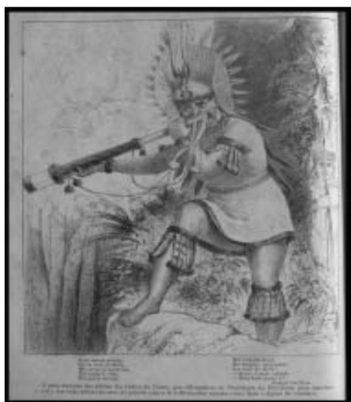
Figura 6: Charge da Semana Ilustrada

O grão cacique das aldeias dos Índios do Ceará, que ofereceu-se ao presidente da província para marchar a testa das suas tribos no caso de guerra com a Grã-Bretanha, mostra como dará o sinal de combate 195