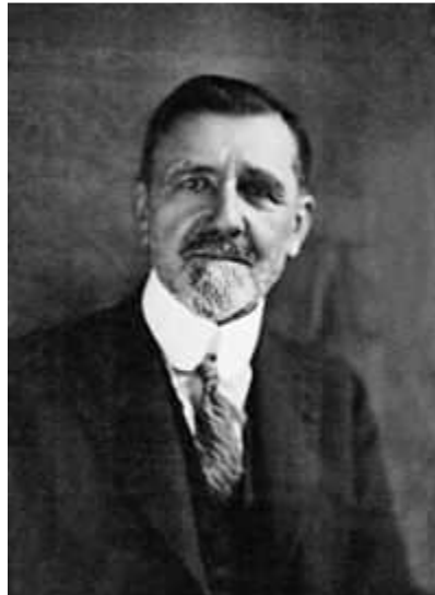
FIGURA 3: Félix Edouard Justin Emile Borel