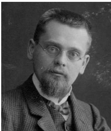
FIGURA 2: Ernst Friedrich Ferdinand Zermelo