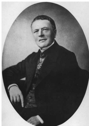
FIGURA 1: Antonie Augustin Cournot