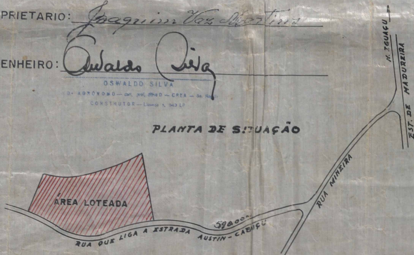
PLANTA DE SITUAÇÃO

OSWALDO SILVA CONSTRUTOR - LULA 1.343.17