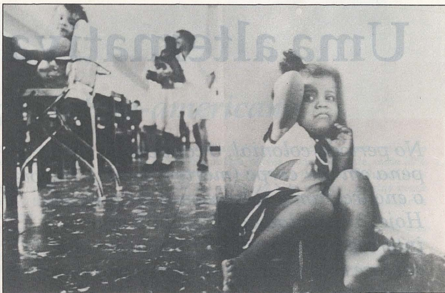
O desenvolvimento emocional da criança internada normalmente fica prejudicado

Várias instituições que funcionavam como ponte entre o Juizado de Menores do Rio de Janeiro e os interessados em adotar foram descredenciadas nos últimos anos por não apresentarem