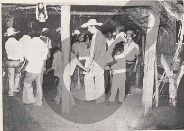
Dança religiosa dos guaranis, com participação do IEM.