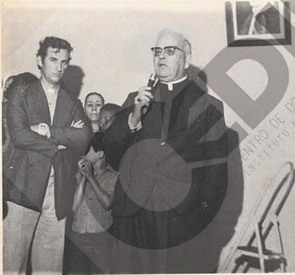
29 — São Pedro e S. Paulo.

Caixa Postal 258 — Nova Iguaçu — RJ CEP — 26.000