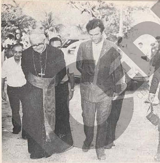
30 — Dia da Bíblia.