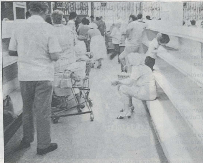
A escassez de alimentos foi atenuada com a venda direta ao consumidor

Com as portas do campo socialista fechadas, Cuba foi obrigada a buscar novos compradores. O mercado de níquel,