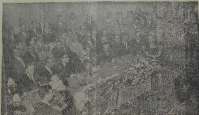
Fotografia histórica. — Flagrante da mesa que presidiu aos trabalhos da Convenção Pessedista Estadual, em 31 de maio último, no Teatro Municipal de Niterói, quando foi lançada a candidatura do deputado Getúlio Moura. Nela se vêem, além do candidato do PSD, o deputado Celso Peçanha, o cel. Barcelos Feio, o deputado Armando Falcão, os senadores Benedito Valadares e Vitorino Freire e várias outras figuras proeminentes do pessedismo nacional.

O povo de Nova Iguaçu, Nilópolis, São João de Meriti, Itaguaí e Duque de Caxias, compreendendo a alta significação da presente campanha eleitoral, está demonstrando possuir um nível de educação política digno de elogios. Municípios vizinhos da capital da República, com índices de progresso dos mais apreciáveis, de há muito reclamavam a oportunidade de elegerem o governador do Estado. Lançando o nome de Getúlio Moura, homem radicado à terra e conhecedor profundo das necessidades da gente cujos interesses defende há mais de trinta anos, com invulgar brilhantismo, formou-se nestes municípios uma corrente de opinião que congrega a maioria absoluta do seu eleitorado. Outra coisa não se poderia esperar de um povo que tem tido em Getúlio Moura o amigo de todas as horas, dos bons e dos maus momentos, devotado aos interesses do povo, tornando-se autêntico paladino na defesa dos supremos anseios da região que representa na Câmara Federal desde 1945.