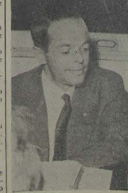
Ele pediu à Mesa a inclusão de vários projetos na pauta dos trabalhos, inclusive os de n.ºs 99 e 242, ambos de interesse do funcionário público fluminense. O referido deputado solicitou também a Comissão Executiva para que sejam publicadas mais exemplares da Constituição do Estado, já esgotados há muito.