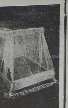
DIXIE de noite