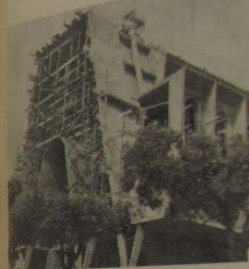
As obras da majestosa Igreja de N. S. de Fátima e São Jorge com os resultados da grande festa de confraternização luso-brasileira. O prosseguimento bem acentuado.

NESTA data festiva, de grande valor para a família católica de Nova Iguaçu, saudamos a todos os iguassuanos, em especial a colônia portuguesa, pela festiva comemoração a Nossa Senhora de Fátima.