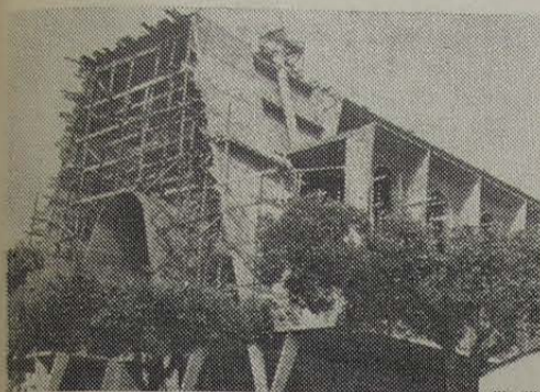
As obras da majestosa Igreja de N. S.ª de Fátima e S. Jorge terão com os resultados da grande festa de hoje, prosseguimento bem acentuado.