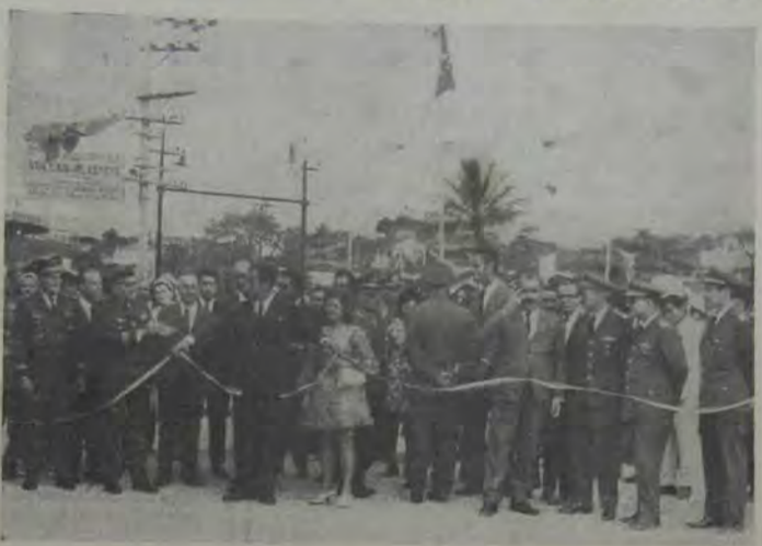
Grande número de autoridades civis e militares, além da presença de uma enorme massa popular, prestigiaram, domingo último, a inauguração da Praça Santos Dumont