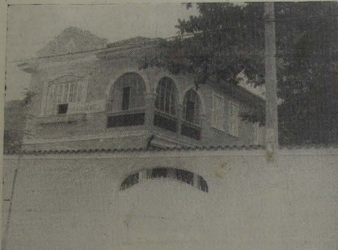
Este é o majestoso prédio da futura sede da CLINICOR

Para Nova Iguaçu, que possui o maior índice populacional fluminense, é motivo de alegria poder contar com um serviço clínico e cardiológico especializado, de que tanto necessitava, enriquecendo sensivelmente a rede hospitalar deste grande Município.