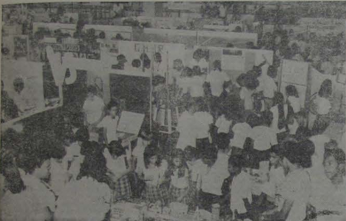
A II Mostra de Ciência e Tecnologia reuniu todos os educandários do Município num só esforço de cooperação e entusiasmo verdadeiramente surpreendentes nesta cidade.

Colégio Professor Anselmo conquista o 1º lugar com 95 pontos