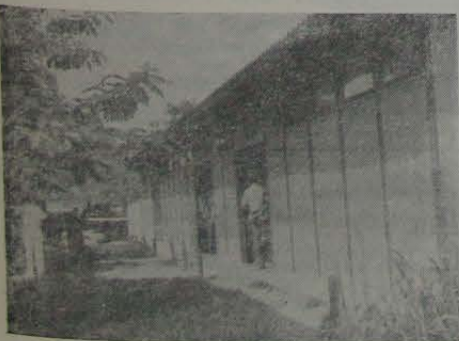
As instalações do Posto de Urgência (um galpão) são precaríssimas e não garantem nenhum atendimento de qualidade melhor ao que está sendo prestado no momento.