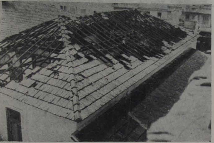
O incêndio danificou bastante o velho prédio do Centro Educacional de Nova Iguaçu.

O Colégio Afrânio Peixoto passa agora a denominar-se Centro Educacional Afrânio Peixoto, de acordo com o art. 1, da Resolução n.º 5/72, publicada em 8/5/72, em que o Conselho Estadual de Educação autorizou a mudança de nome. É realmente indescrevível o entusiasmo das crianças que frequentam a Colônia de Férias, funcionando no CEAP às terças, quintas e sábados na parte da manhã. A Secretaria vem executando normalmente os trabalhos de renovação de matrícula. Para os novos alunos, a Secretaria comunica que as matrículas serão abertas no próximo dia 21. Inúmeras salas estão sendo instaladas e outras adaptadas as diversas atividades extracurriculares.