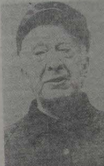
Siqueiros (foto). Juntamente com Rivera e Orozco ele revolucionou a pintura mexicana e mundial e foi o artista mais glorificado e punido de seu país — somadas as penas por atividades políticas, passou na prisão cerca de uma década. Seu último grande trabalho — A MAR-CHA DA HUMANIDADE — é um exemplo da técnica de pintura que foi um dos criadores —