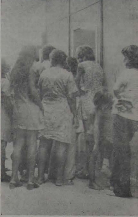
Essa visão é frequente no Posto de Urgência do INPS (antigo SAMDU). Os segurados se acotovela em filas intermináveis, à espera de um atendimento quase sempre precário.