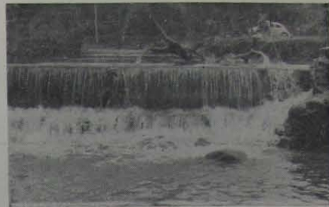
Não há menor dose de aquiescência ou concordância. Nem mesmo gramatical, como qualquer um pode ver.