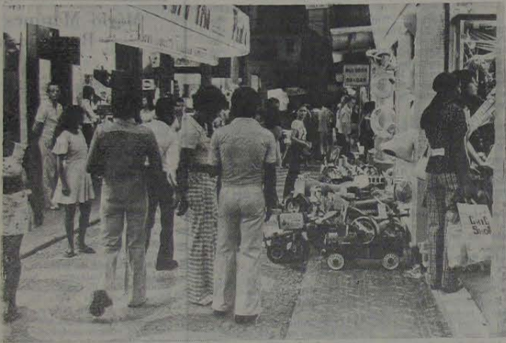
Muita gente o'hando e pouca gente comprando, muito pouca mesmo, eis a característica, em, nas ruas deste Natal 75.

Onde estão os ideais de igualdade e fraternidade (postulados cristãos e universais) neste quadro de miséria, neste mundo degradado por todas as formas de violência e opressão? Chegaríamos hoje a saudar o esperado Messias, caso o seu retorno se consolidasse em carne e osso? Evidentemente que não, pois o que temos presenciado, a cada dia que passa, é a negação de tudo aquilo que se pegou um dia em defesa da instauração de um reino de paz e compreensão entre os homens. Os clarins da Galiléia, anunciadores de um novo mundo, se calaram ao longo da História, foram abafados pelo imediatismo, pelo utilitarismo, pela vitória do lucro sobre a razão. Do lucro acumulado no ócio burguês contra a fome e a inanição das massas trabalhadoras. Pobres e ricos jamais se sentarão na mesma mesa natalina, pois a realidade desse mundo cruelmente materializado distanciou de tal modo o pobre do rico, que a sobrevivência de um representará fatalmente a destruição do outro. Caminhos, assim, para um futuro de inevitável dúvida quanto aos princípios sugeridos pelo 25 de dezembro. Ano após ano, em meio ao clima orgiástico do Natal, falece, na embriaguez de um só dia que tenta abafar os pecados do ano inteiro, toda a fraternidade possível e necessária, para que possamos vislumbrar, nos duros caminhos da vida, alguma possibilidade de paz e verdadeira felicidade.