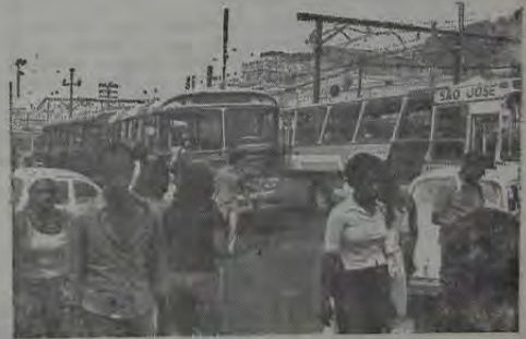
As autoridades responsáveis pelo trânsito em Nova Iguaçu - que não se identificam quando cometem seus desatinos - provocaram mudanças no início desta semana que só servirão para tumultuar uma vez mais o tráfego de veículos no centro da cidade.