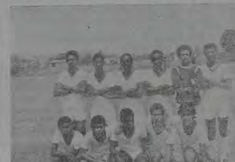
A equipe do EC São Pedro, campeã do primeiro turno do Torneio Osmário Castellar Filho, pela Chave Julio Silva.

Na Chave Ismael de Castro Rocha o Progresso goleou o Barcelona (jogo transferido da segunda rodada) pela contagem de 5 a 1 e o Flamengo (de Austin) empatou com o ICEBU de 3 a 3.