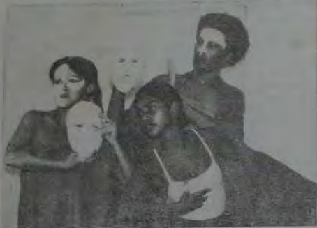
A dança-teatro, uma das atrações da Aula Viva da Centerartes.