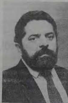
Lula vai se beneficiar, no segundo turno, da grande votação que Brizola teve na Baixada.

do Estado do Rio de Janeiro, esse tipo de promessa vazia já não cola mais. Moreira Franco, em 86, prometeu a mesma coisa, mas não cumpriu. Ao contrário, vários CIEPs foram desativados em seu Governo e mesmo os que estão funcionando, não adotam mais o regime de turno único, o que obrigava a escola a conceder três refeições diárias aos alunos. Collor, certamente, só está interessado em pegar os votos brizolistas.