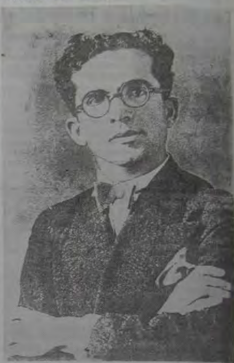
Uma Grande Vida.

Biografias e impressões gerais: Graças sobre Graças e