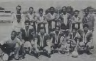
O Unidos de Olinda reencontrou o caminho da vitória

A equipe de futebol, categoria veterano, do Unidos de Olinda FC, lá de Anchetá, finalmente reencontrou o seu melhor conjunto. O time, na manhã do último domingo, derrotou a representação