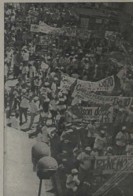
Os militantes do PT lotaram o Calçadão no último sábado.

Na manhã de sábado, dia 26, o centro de Nova Iguaçu ficou ocupado por mais de 500 militantes do Partido dos Trabalhadores, espalhados em mais de 70 pontos de panfletagem no município. O evento, denominado Assine Esta Bandeira, também contou com a participação dos simpatizantes do PT e com a presença dos deputados Artur Messias, Jorge Bitar, Carlos Santana e Antônio Biscaia, além de todos os candidatos a vereador da aliança entre o PT e o PCB.