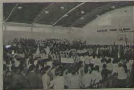
Mais de mil alunos lotaram o Ginásio da Vila Olímpica na abertura dos IV Jogos Estudantis.