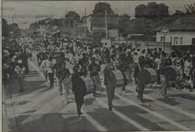
No ano passado, o desfile cívico-escolar em Queimados realizou-se na Estrada dos Caramujos.

em Queimados acontecerá nos dias 3 e 7 de setembro. No dia 3 o evento será realizado na Estrada Francisco Antônio Russo (antiga Estrada dos Caramujos) e no dia 7 as escolas desfilarão na Avenida Tingüá, no Centro. Em todos os dias o início do desfile será às 8 horas. Há dois anos consecutivos o Desfile Cívico acontece na Estrada dos Caramujos.