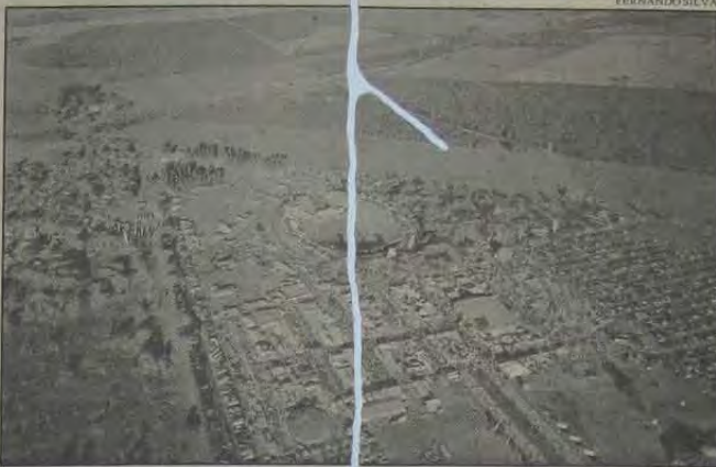
Vista panorâmica da grande Arena de Barretos, onde se realiza, anualmente, a maior festa do Peão Boiadeiro do País.

Comendo pelas bordas, Barretos conseguiu chegar ao pódio. A Festa do Peão Boiadeiro, é maio que o carnaval do Rio, Salvador e Recife. Maior que as festas de São João no Nordeste, os picos religiosos de Aparecida (SP), as romarias de Juazeiro (CE) ou o Círio de Nazaré, em Belém do Pará.