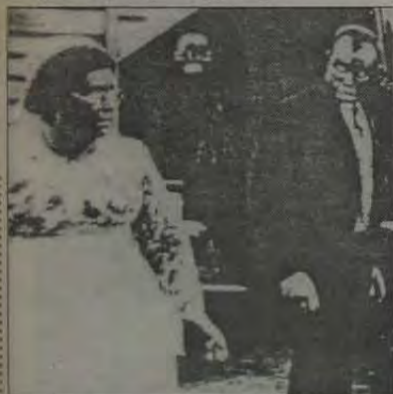
"Nascimento de uma Nação", se foi um marco na história do cinema, também revelou como os brancos encaravam os negros. A exclusão, amparado num preconceito brutal, sequer admitia a presença de negros nos filmes. O negro era branco, com o rosto pintado de preto.

Os anos passaram, a luta pela liberdade e dignidade do negro americano foram sendo conquistada com muito sangue. A consciência negra vinha nas palavras de grandes líderes como Martin Luther King. E o cinema, a partir da década de cinquenta, passa a mostrar uma nova realidade, uma nova imagem do negro americano.