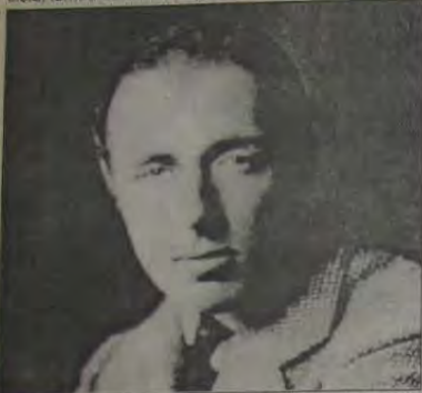
David Wark Griffith, um dos mais celebrados pioneiros da arte cinematográfica.

Com o lançamento do filme "Nascimento de uma Nação" (The Birth of a Nation, 1915), o cinema como arte, como propaganda política e como diversão chegava à sua maioridade. O filme provocou entusiasmo no público e na crítica. Nada antes havia acontecido nas telas de tão grandioso. O primeiro superespetáculo em técnica e arte. Com inovações, criou uma variedade de técnicas cinematográficas, que influenciaram profundamente o cinema no mundo inteiro. Mesmo assim, o filme pelo conteúdo extremamente racista, tornou-se uma obra polêmica.