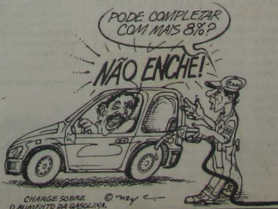
CHARGE SOBRE O AUMENTO DA GASOLINA.

NetIguassu registra mais de 1,3 mil acessos