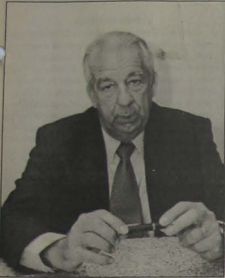
Távora considerou de grande valia para a economia do Estado do Rio a visita da missão empresarial aos Estados Unidos.

Távora integrou missão liderada pelo Governador do Estado e que atraiu importantes investimentos para o Rio de Janeiro