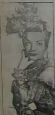
A legendária Carmen Miranda, portuguesa que se tornou brasileira de corpo e alma, numa trajetória que percorreu do rádio para o Cinema da Ucla, ganhou os Estados Unidos com seu talento e charme, chegando, nos anos 40, a ser um dos maiores célebres do cinema americano.