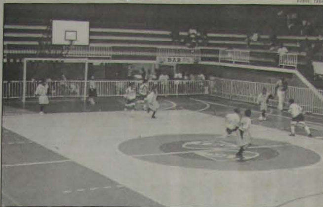
Iesa e IBC fazem a grande final da I Copa Rio de Futsal

Numa semi-final verdadeiramente espetacular, disputada na última quarta-feira, dia 6, no ginásio do Vasquinho de Morro Agudo, a partir das 19 horas, foram definidos os finalistas da I Copa Rio de Futebol (categoria Mirim).