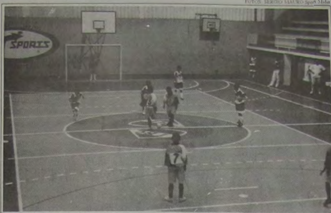
A IV Copa Rio de Futsal (categoria infantil) começará no dia 25 de setembro.

A quarta edição da Copa Rio de Futsal (categoria infantil) vai começar no dia 25 de setembro. Seis equipes - Iguaçu, IBC, Percepção, Olaria, Evangelico e CULP - vão disputar a competição que está dividida em três fases: classificatória, semi-final e final. Na primeira fase todas as equipes jogarão entre si, em um só turno, sendo que as quatro primeiras colocadas passarão para a semi-final. Os vencedores da semi-final vão disputar o título desta competição que já faz parte do ca-