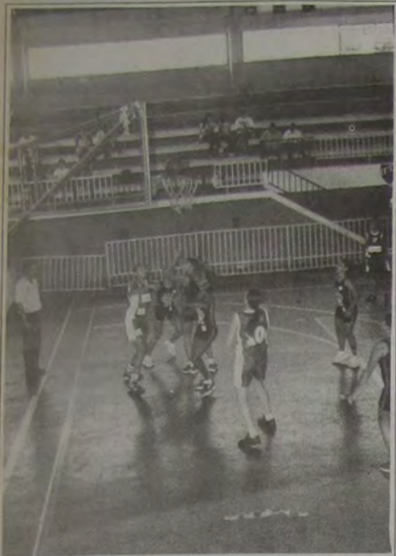
A Copa Rio de Seleções promete jogos disputadíssimos.

Instituto Brasil/IBC representa Nova Iguaçu na Copa Rio de Seleções