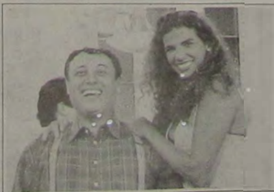
O casal simpático de "Zorra Total", Pedro Bismark e Luciana Coutinho, dão um show nas noites de sábado