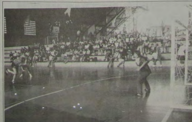
O handebol feminino é uma das principais modalidades esportivas atualmente em prática na Baixada Fluminense.