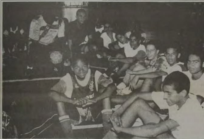
Com remotas chances no campeonato da AFSEJ, o IBC tentará o título na IV Copa Rio de Futsal.

A novidade desta quarta edição será o sistema de rodadas flutuantes, já que cada equipe participante terá o direito de sediar uma rodada. O Iguaçu Basquete Clube vai sediar a abertura do certame.