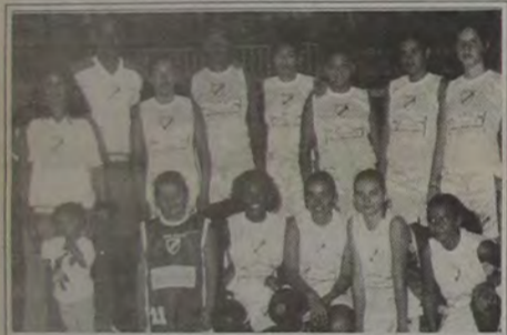
A Seleção de Nova Iguaçu formada pelas equipes do Instituto Brasil e IBC.

A organização da competição está a cargo da SportMídia e conta com o apoio da Secretaria de Estado e Desenvolvimento da Baixada Fluminense (SEDEB). Maiores informações pelo e-mail: sportmidia@bol.com.br.