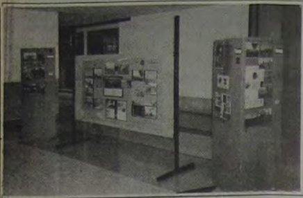
Painéis com gravuras e fotos na Expô "A História do Vôo Livre no Brasil", promovida pelo Clube de Vôo Livre da Serra do Vulcão

De 26 de agosto a 1º de setembro, o Clube de Vôo Livre da Serra do Vulcão realizou no Shopping Conjunto Nacional, em Brasília, uma exposição sobre a história do vôo livre no Brasil. As galerias do primeiro shopping da capital do país foram decoradas por painéis ilustrados por belas imagens do esporte, além de asas delta, equipamentos de vôo livre, medalhas, troféus e diplomas conquistados pelas equipes brasileiras ao longo dos anos. Os grandes destaques foram os painéis que retratavam o início deste magnífico esporte: o Rio de Janeiro, onde em 1974 o francês Stephan Dunoyer Du Segonzac arribou o 1º vôo em asa delta no Brasil, decolando do Cristo Redentor indo pousar suavemente no Jockey Clube. As conquistas e a trajetória do jovem Pedro Paulo Lopez, o Pepê, também foram destaque com troféus, medalhas e diplomas conquistados pelo piloto durante o título mundial no Japão, em 1981.