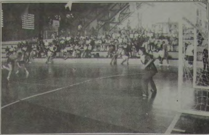
Um bom público é esperado para a Copa Talento de Handebol Feminino (categoria infantil).

Quatro equipes disputam, neste domingo, dia 16, a partir das 10 horas, no ginásio do Iguaçú Basquete Clube (IBC), a Copa Talento de Handebol Infantil.