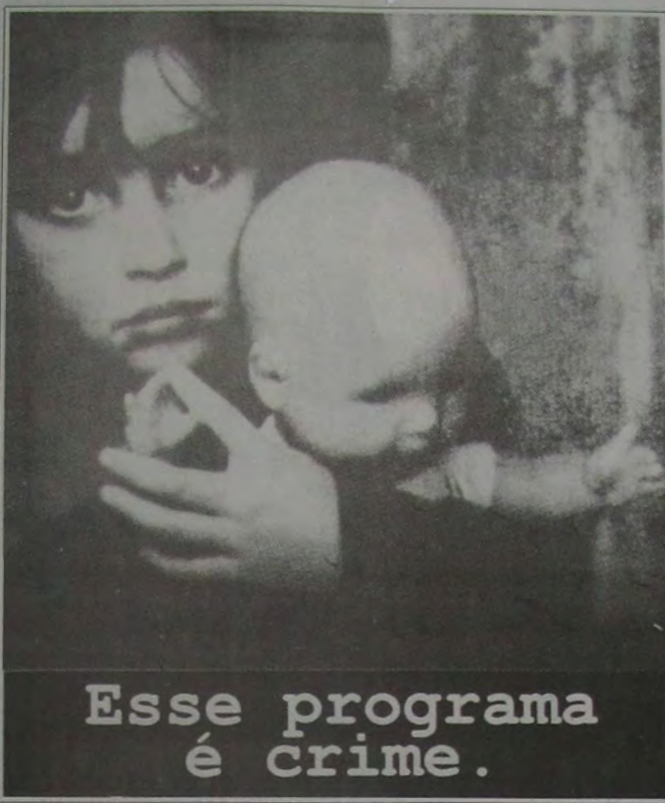
Cartaz de divulgação da campanha de Combate à Exploração Sexual de Crianças e Adolescentes

Realizou-se, na última terça-feira, no Centro Social São Vicente, antigo Patronato, em Nova Iguaçu, o encontro promovido pelo Centro de Referência para a Infância e Adolescência de Nova Iguaçu, onde seria apresentado o Programa de Combate à Exploração Sexual de Crianças e Adolescentes. O encontro estava marcado para às 14 horas, mas só começou uma hora e meia depois, sem nenhuma justificativa plausível para o atraso. O assunto a ser abordado, que era a campanha contra a exploração sexual do menor, ficou em segundo plano e a discussão passou a ser sobre a prática, funcionamento e rela-