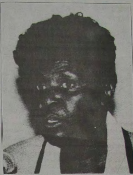
Benedita da Silva

Segundo o líder da Bancada do PT na ALERJ, deputado Artur Messias, o governo do PT, com Benedita da Silva, dará continuidade aos projetos e programas do atual governo, tais como o "Cheque Cidadão" e o "Restaurante Popular". "No máximo o que faremos será dar-lhes um tempero petista, garantindo transparência na aplicação dos recursos e o controle social", acrescenta Messias. Ele, entretanto, não descarta a necessidade de alguns programas passarem por um processo de auditoria, já que há fortes indícios do dinheiro estar sendo mal empregado. São exemplos o Programa de Despoluição da Baía de Guanabara (PDBG) e o Pro-Sanear,