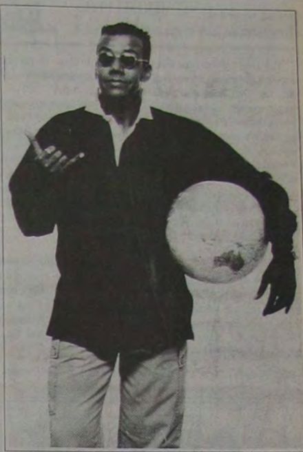
Jorge Ben Jor

Outra atração ansiosamente esperada é o consagrado Grêmio Recreativo Roda Quem Pode, de Quicados, que irá se apresentar para o público a partir das 23 horas.