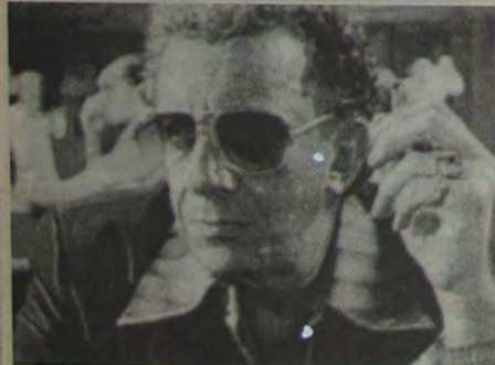
Marco Nanini é o ator principal de "Lisbela e o prisioneiro", em cartaz no Iguaçu Top 3

● IGUAÇU TOP 3 - "Lisbela e o prisioneiro" (continuação). Filme nacional com Marco Nanini, Selton Melo e Debora Falabella. Censura: 12 anos. Horário: 15h - 17h - 19h e 21 horas.