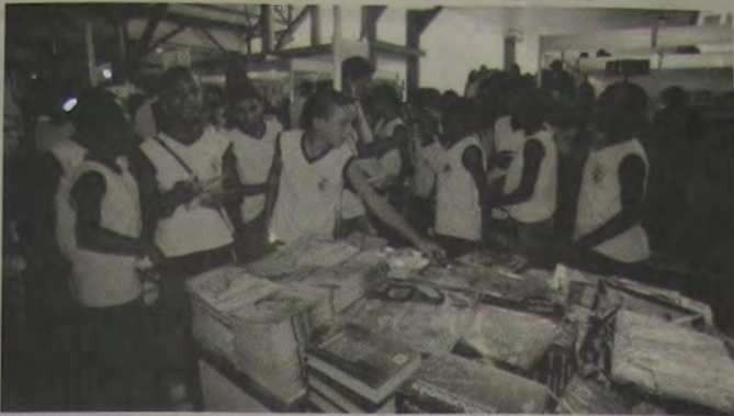
Crianças e adolescentes, uniformizados ou não, fizeram a festa na 1 Bienal do Livro de Nova Iguaçu.

Mais uma hora para a cultura e os livros neste final de semana. Em reunião com seu secretário, o prefeito Mario Marques anunciou que o horário de funcionamento da 1 Bienal do Livro de Nova Iguaçu será estendido até às 22h no sábado e no domingo, últimos dias do maior evento literário da Baixada Fluminense. Mais de 80 mil pessoas já passaram pelos estandes montados no Sesc desde o dia 3, quando a Bienal foi aberta.