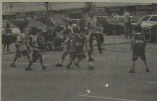
O futsal é a modalidade mais procurada pelas crianças no Domingo Esportivo.

ça das escolas de samba mirins da Beija-Flor (Nilópolis) e Grande Rio (Caxias), numa super-apresentação.