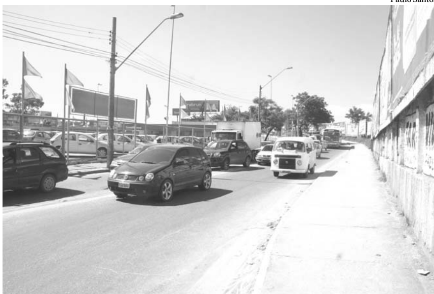
A experiência de mão única (sentido centro) no Viaduto do Posto Treze foi considerada positiva pelo secretário de Transporte Rholmer Louzada

Quem passou pelas redondezas do viaduto do Posto Treze esta semana durante a manhã foi surpreendido por uma mudança no sentido do trânsito. Na busca por uma solução para dar fim aos congestionamentos diários naquela região, o secretário municipal de transporte e Nova Iguaçu, Rholmer Louzada Junior, fez uma experiência no local.