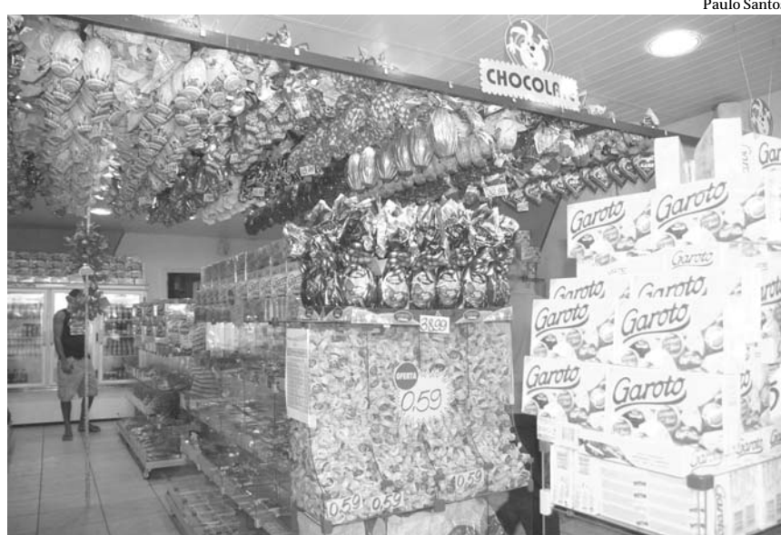
Pelo menos no varejo de doces e guloseimas, os comerciantes foram unânimes em afirmar que as vendas da Páscoa superam as do Natal

Comerciantes apostam nas caixas de bombom e deixam ovos de chocolate de lado