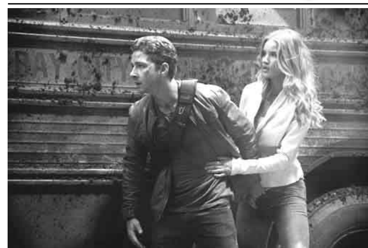
O filme Transformers 3: O lado oculto da lua está em cartaz no Iguaçu Top 1

Grupo Severiano Ribeiro – Iguaçu TopShopping – Telefone: 2461-2461