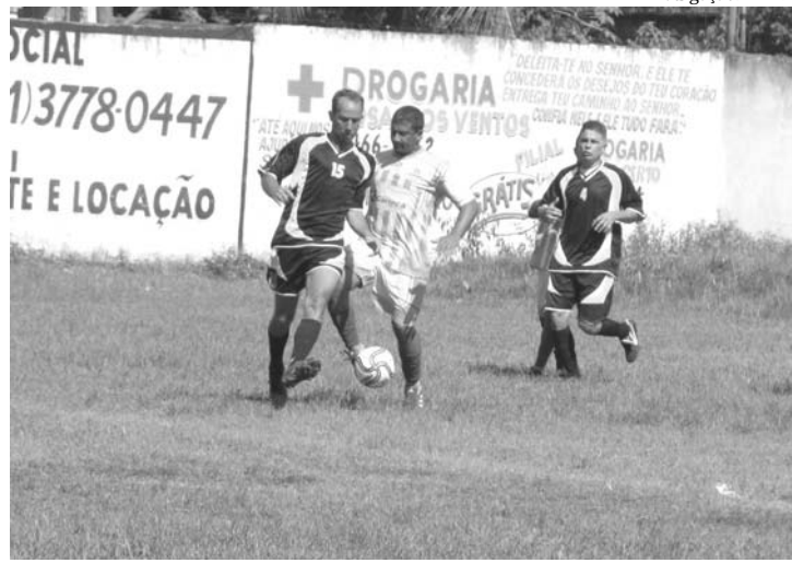
A fase semifinal da Taça Cidade de Nova Iguaçu (Master), terá o jogo entre Esperança e Arte Trígoli como carro chefe neste fim de semana