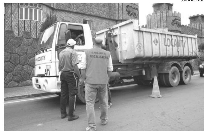
A barreira na entrada do Bairro da Posse não deixou que caminhões de lixo seguissem para o aterro

A barreira foi montada em um dos principais acessos ao CTR, nos bairros da Posse e