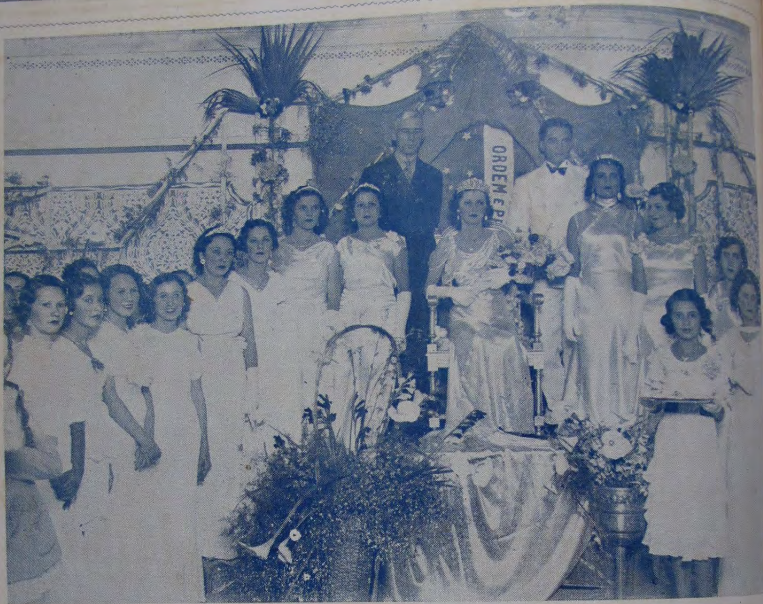
A rainha e a sua côrte primavera logo após a sua coroação, ladeada pelo exmo. sr. Prefeito do Municipio, do nosso director e demais pessoas presentes