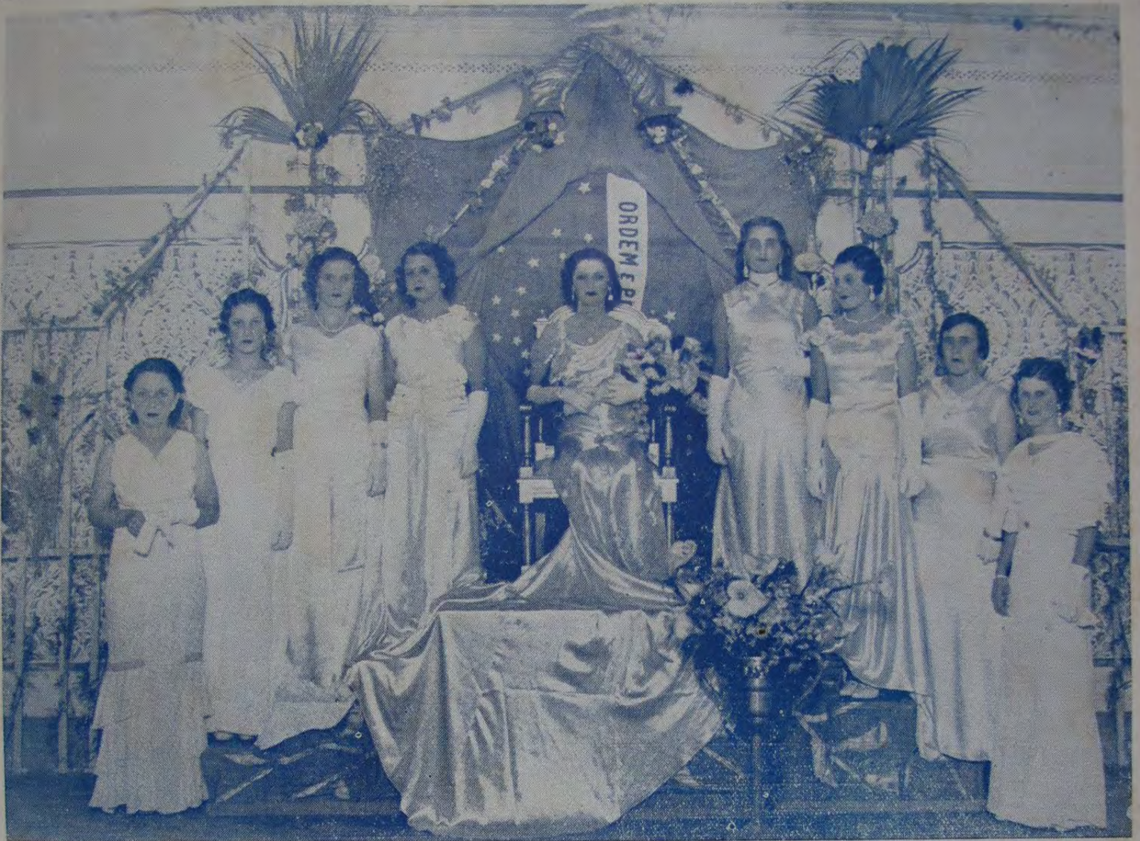
A rainha e a sua côrte primaveril, antes da coroação