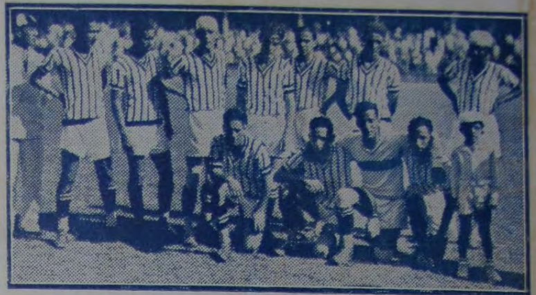
O valoroso team do S. C. Iguassú, campeão deste municipio, que enfrentará hoje, em seu campo, o Filhos de Iguassú F. C.