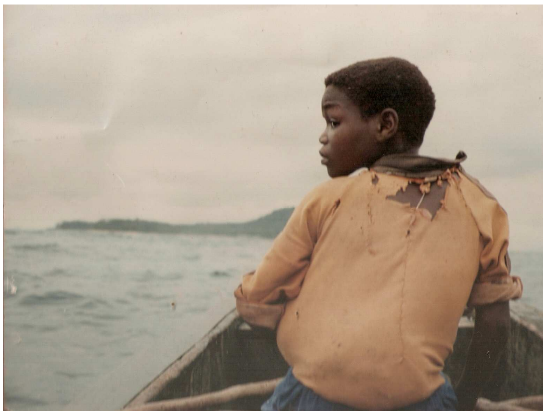
Criança nos mares de São Tomé, de volta a sua comunidade, transportando bolsa com farinha de mandioca (nas costas, protegida pela camisa). Foto do autor, São Tomé e Príncipe, 1992

Dedico esta tese aos meus pais que, pelas suas convicções e ações geraram em mim, desde muito cedo, este projeto sempre em construção. Ao Lucio Lara por, desde criança, no Huambo, dar açúcar às formigas.