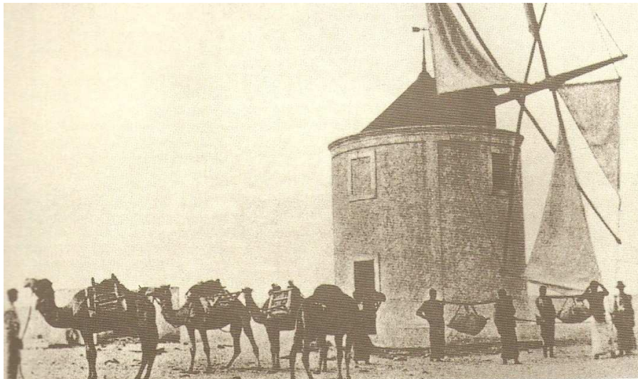
Foto 4 - Moinho construído pela família Torres, de Pernambuco, junto ao porto da cidade de Moçâmedes, onde também se podem ver camelos provenientes do Nordeste do Brasil. 5€

Também de Pernambuco vieram, em 1849, duzentas famílias que se fixaram em Moçâmedes (PINTO,1987:197) , como mostra a foto abaixo, que retrata o moinho construído pela família Torres junto ao porto da cidade, e os camelos aparentemente utilizados no transporte de pessoas 55 .