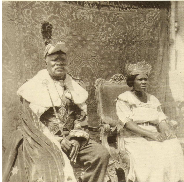
Foto 1 - D. Pedro VII, quadragésimo oitavo monarca do reino do Congo, e sua esposa, D. Isabel Fonte: Salvador (2004)

Mas a pilhagem de escravos era já muito comum tendo os traficantes chegado a diligenciar um atentado contra o sucessor de Nzinga (João). Note-se que em 1530 o número de escravos exportados era de cerca de 4000 a 5000 peças (Boxer, 2004:113). 7