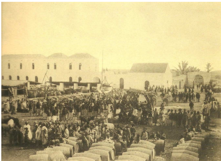
Foto 3 – Engenho na região do Dombe, fundada por imigrantes de Pernambuco.

Ela aumentará os lucros dos comerciantes e senhores de engenho 45 , aumentará a oferta de escravos 46 e assegurará a importância brasileira sobre o trato negreiro. Manter-se-á como moeda-mercadoria em Angola até o século XX, como veremos mais adiante, tendo os primeiros engenhos sido estabelecidos face à ligação ao Brasil. Na foto abaixo pode ver-se um engenho na região do Dombe, fundada por imigrantes de Pernambuco.