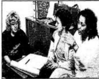
Advogadas da 3ª Sub-Setção de CMA garantem direitos da mulher

"Em briga de marido e mulher, ninguém mete a colher!". Esta foi a resposta ouvida por uma maradona de Jacarepaguá, no dia 19 de junho, ao tentar registrar na Delegacia de Polícia uma queixa contra os espancamentos impostos a ela pelo seu companheiro. Ao contrário de muitos casos que acabam por aí, ela procurou a Comissão Feminina da 3ª Sub-Setção da