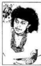
Mulher de baixa renda cansou de apanhar, mas não vê perspectivas.

prioritariamente, com equipes formadas exclusivamente por mulheres, a exemplo do que já ocorre em São Paulo. A Comissão de Mulheres pede também a ampliação dos serviços de assistência social existentes nas delegacias. Para a polícia, os assistentes ajudam nas chamadas "pessoas encarceradas". Mas a prática demonstra que elas são o primeiro passo para