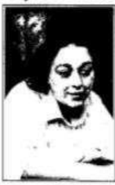
Em muitos casos, o desemprego e a bebida são motivo para as agressões.