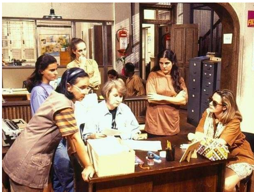
Figura 9. O cenário interior da Delegacia de Mulheres onde é possível identificar a sala da delegada ao fundo.