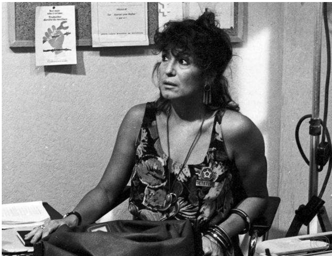
Fig. 7. Susana Vieira como Rute Baiana