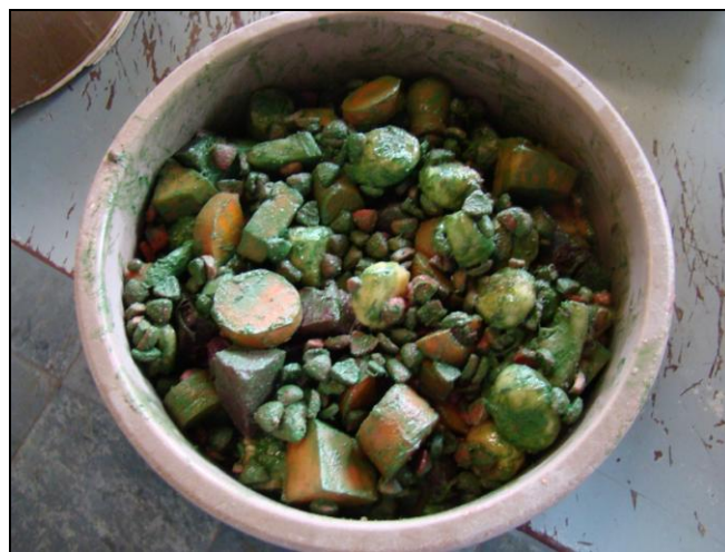
Figura 5. Alimento ofertado misturado ao cromo

Os animais foram submetidos a quatro tratamentos onde foi utilizada a dieta do criadouro como base, visando minimizar disfunções gástricas derivadas do consumo excessivo dos demais alimentos (Tabela 3). As dietas eram preparadas na cozinha do criadouro, pesadas, misturadas manualmente a 0,2% de cromo e oferecidas em comedouros plásticos (Figura 5), sempre no mesmo período e local (09:00 às 10:00 h).