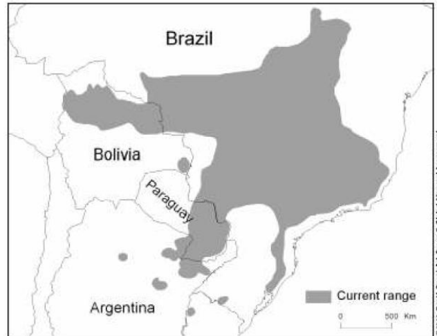
Figura 1. Distribuição atual do Lobo-Guará ( Chrysocyon brachyurus ) segundo Rodden et al. (2004).

É um animal basicamente noturno e crepuscular, podendo também ser visto em atividade durante o dia. Possui hábitos solitários, podendo ocasionalmente ser visto em casais, especialmente na época reprodutiva. Possuem uma área de vida grande podendo variar de 25,2 a 57,0 km 2 (Dietz 1984; Silveira 1999; Rodrigues 2002; Melo et al. 2007), os motivos desta variação podem ser atribuídos a diferenças entre as necessidades de macho e fêmea, diferentes quantidades ou qualidade de alimento nas áreas ocupadas por cada indivíduo (Mizutani & Jewell 1998; Biró et al. 2004), ou ainda a disponibilidade de alimentos nas áreas percorridas por cada animal (Mizutani & Jewell 1998). O lobo-gaurá delimita sua área de vida através de fezes, urina e vocalizações (Vaccaro & Canevari 2007), sendo um animal muito tímido que teme a presença humana.