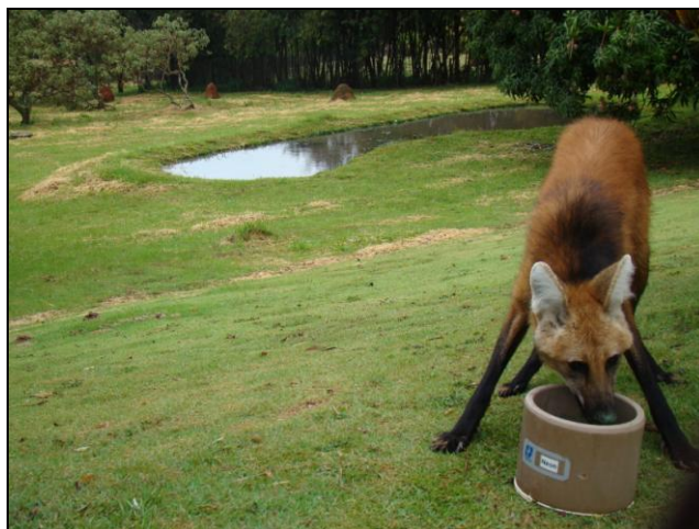
Figura 4. Recintos amplos e com lago artificial.

Tabela 2. Dados dos recintos onde foram realizados os experimentos de digestibilidade de alimentos pelo lobo-guará, no Centro de Desenvolvimento Ambiental da Companhia Brasileira de Mineração e Metalurgia (CBMM, Araxá, MG).