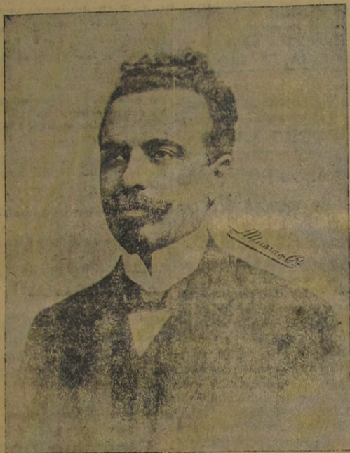
SENADOR NILO PEÇANHA

A morte de Nilo Peçanha deixa, hoje, uma lacuna imprehensível no coração de quantos viam na figura do grande estadista não só uma esperança mas uma atalaia para os dias sombrios que vamos atravessando. Fundador da Republica, deputado pela Constituinte, ministro do Exterior, senador, presidente, por duas vezes, do Estado e da Republica — Nilo Peçanha deixa, como politico e administrador, um traço immorredouro e forte do seu character, que é bem um exemplo que ha de ficar para as gerações de amanhã.