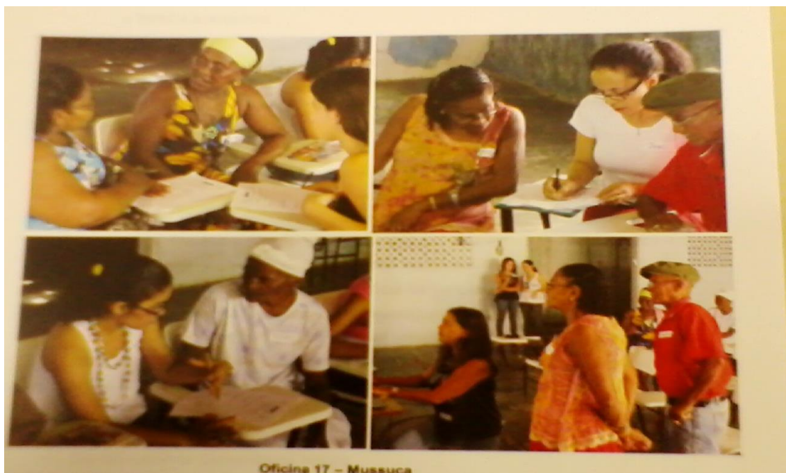
Figura 18: Mestres informando consultores da Brasília/IPHAN – colheita de dados com os Mestres Populares do Povoado da Mussuca.

Segundo o projeto Base do IPHAN/Sergipe iniciado em 2007, é considerado “como base a importância do que a comunidade de Laranjeiras destaca como representativo de sua identidade cultural, isto constitui o princípio norteador da seleção dos bens a serem identificados e definiu o eixo focal das atividades desenvolvidas”, (INCR, 2011).