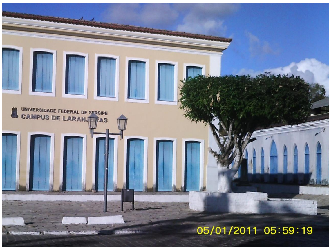
Figura 01: Fachada UFS - Campus Laranjeiras