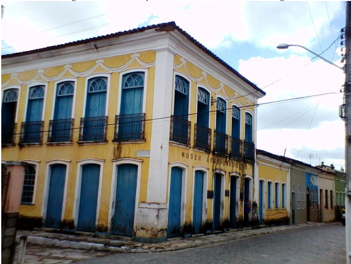
Figura 10: Museu Afro Brasileiro (Laranjeiras/SE)