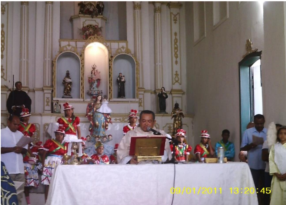
Figura 13: Taieiras no altar- Igreja de São Benedito* Taieiras dança(Centro da cidade)