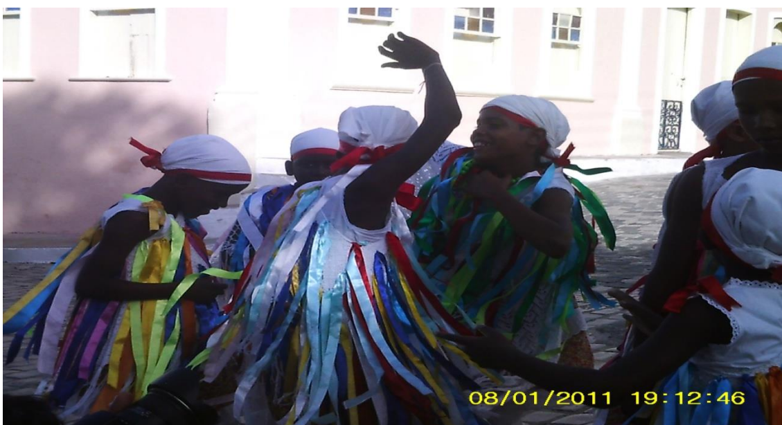
Figura 11: Crianças "Do São Gonçalo da Mussuca" São Gonçalo do Amarante dança