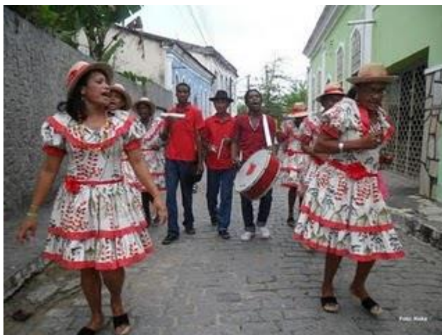
Figura 3: Samba de Coco da Mussuca

apresentações externas o grupo é composto pelas mulheres que dançam e pelos homens que tocam os instrumentos.