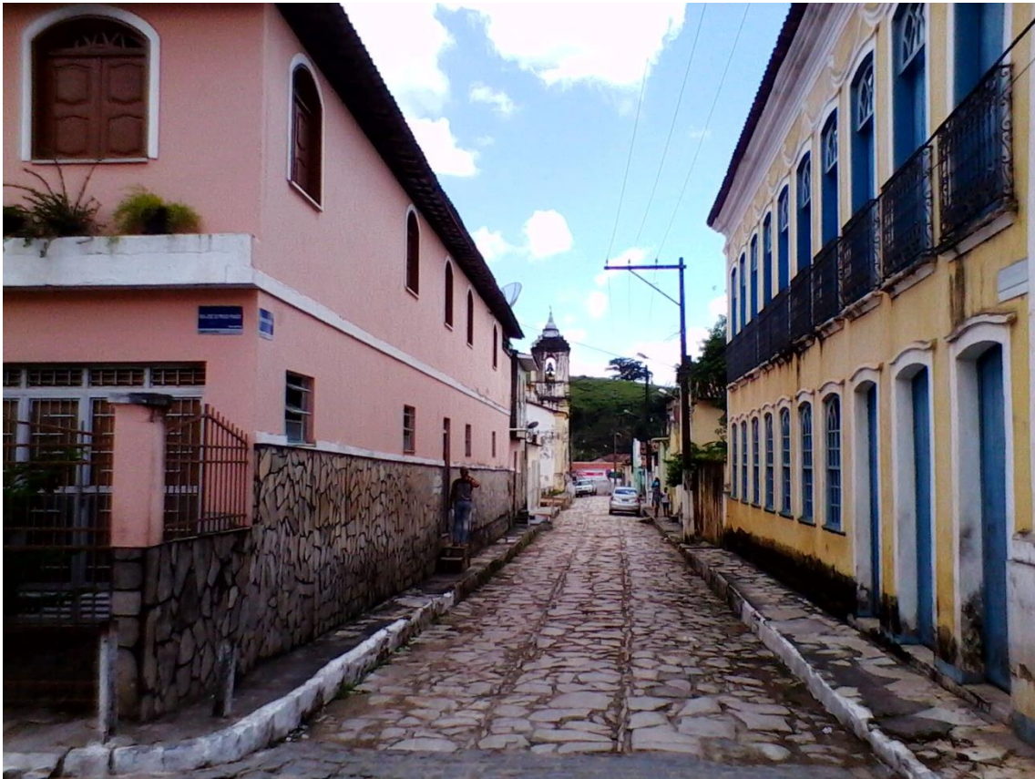
Figura 11: Rua das Pedras