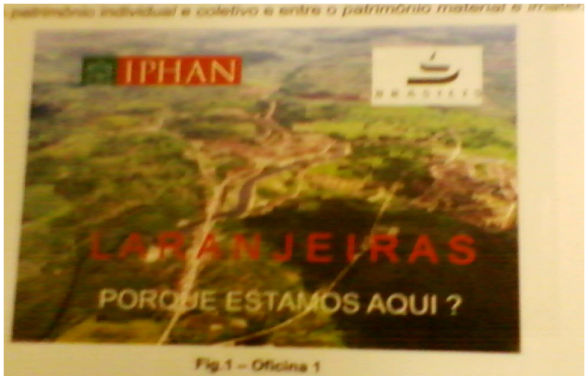
Figura 17: "Porque estamos aqui?"

Em resposta a questão colocada na foto do IPHAN/Brasília - " Porque estamos aqui? " sobre sua presença no município, podemos dizer que empresa: Brasília contratada pelo IPHAN em 2007 esteve presente no município de Laranjeiras fomentando ações que favorecessem aos seus pesquisadores identificar as Celebrações, os Ofícios e Modos de Fazer, as Formas de Expressões e os Locais que retratam a cultura e a memória junto aos moradores, como esta proposto no item 8 da Carta de Fortaleza datada de 14 de novembro de 1997 escrita no Seminário denominado "Patrimônio Imaterial: Estratégias e Formas de Proteção" em comemoração aos 60 anos de criação do Instituto do Patrimônio Histórico e Artístico Nacional –