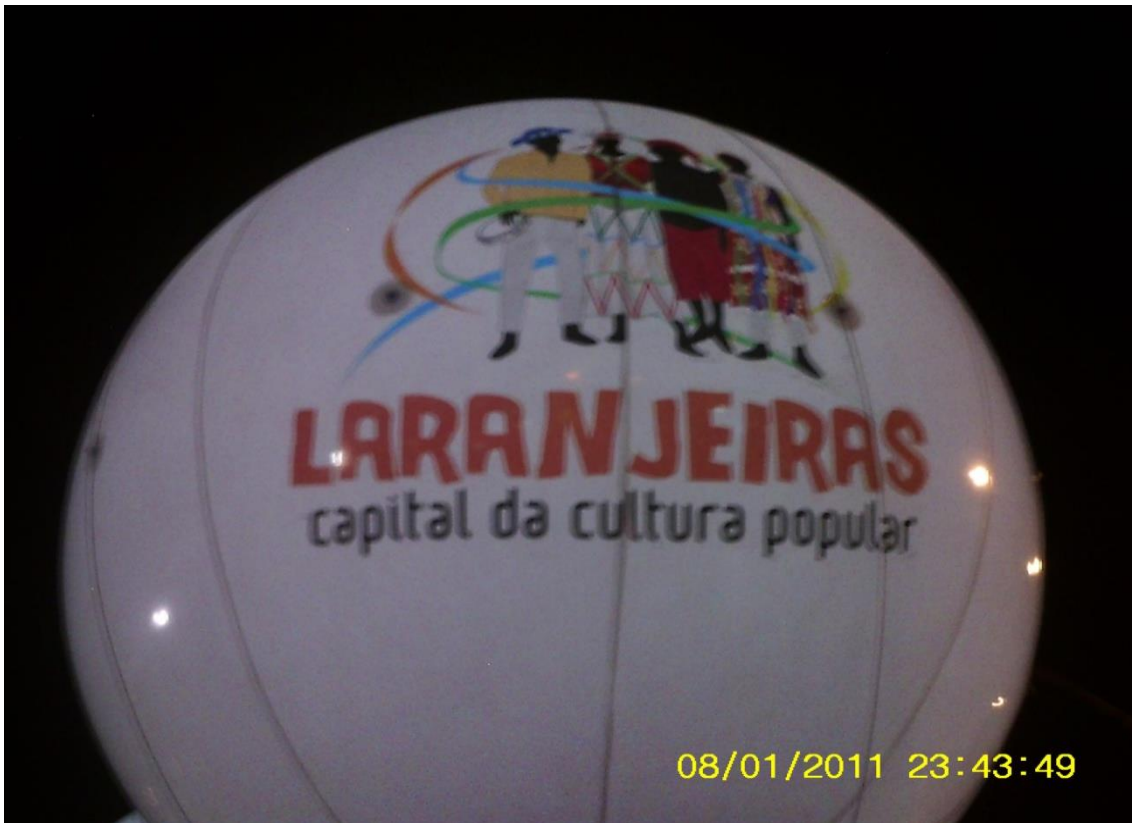
Figura 6: "propaganda da Cidade em dias de Encontro Cultural"