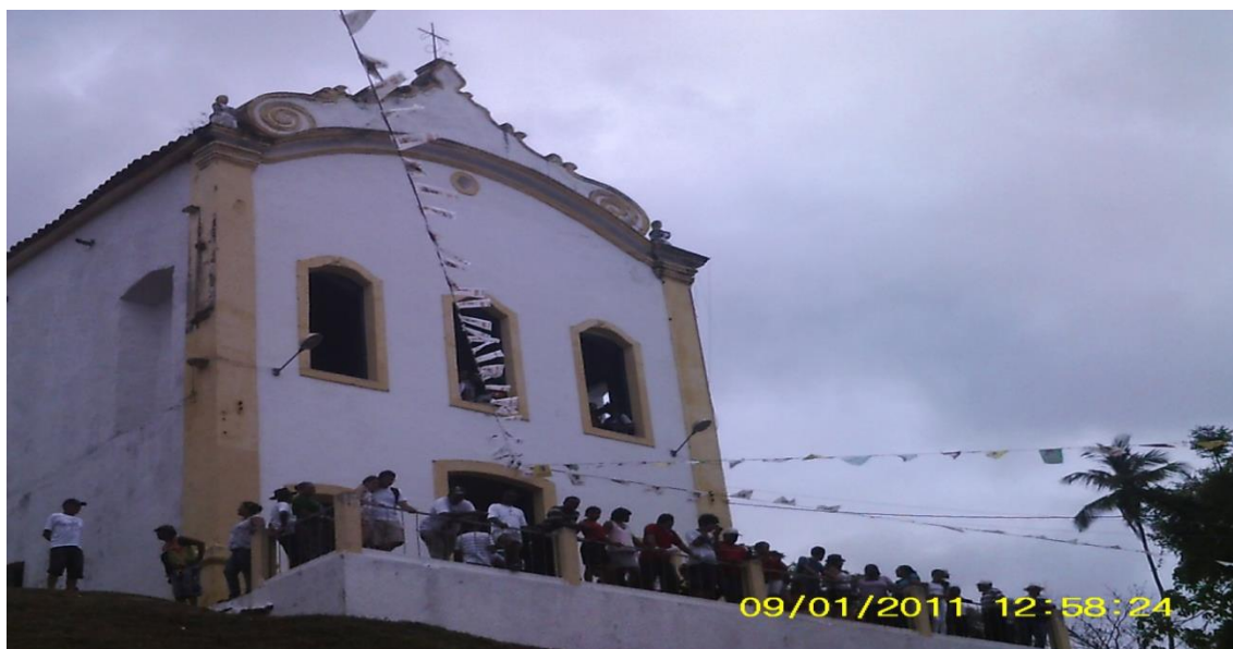
Figura 1: Igreja de São Benedito "Em festa de Reis ano 2012"

No livro “Laranjeiras Católica” publicado em 1935 por Filadelfo Jônatas de Oliveira, podemos encontrar referências sobre as tradições e manifestações populares em forma de danças e folguedos pertencentes a estas populações negras. Associadas ao catolicismo estas manifestações são o ponto alto do dia dedicado aos santos Reis.