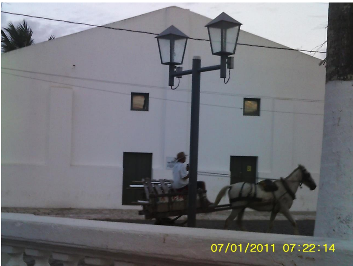
Figura 05: Fachada da Secretaria de cultura de Laranjeiras