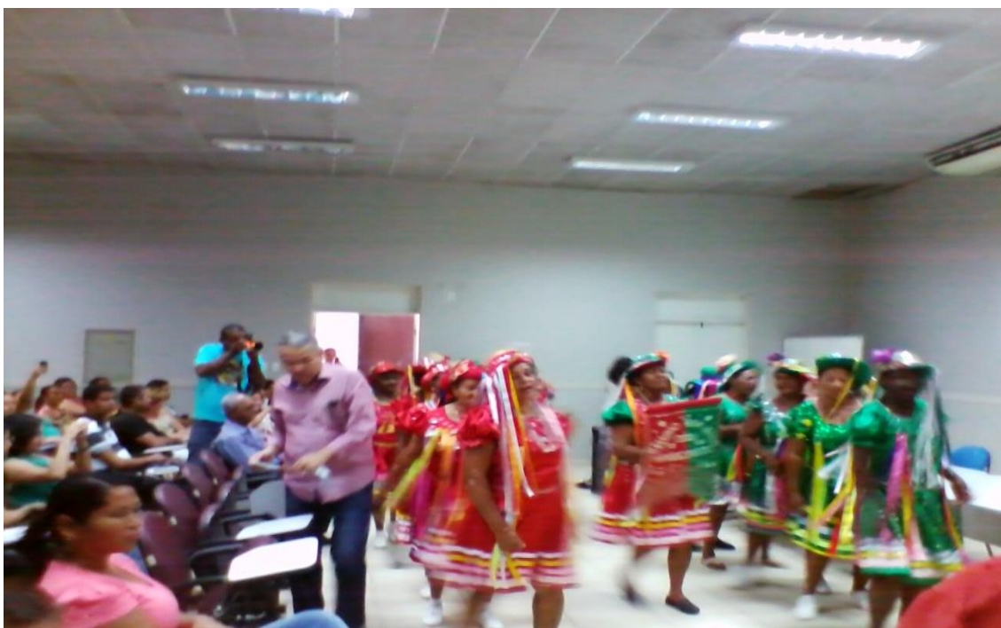
Figura 19: Apresentação de um Reisado no auditório da UFS LARANJEIRAS - "Curso sobre Patrimônio para os professores da rede de ensino público estado e município ministrado pelo IPHAN.

No caso de Laranjeiras o que pode ser observado em relação à categoria patrimônio junto aos moradores e participantes das tradições vivas nos remete a pensar esta categoria de forma peculiar.