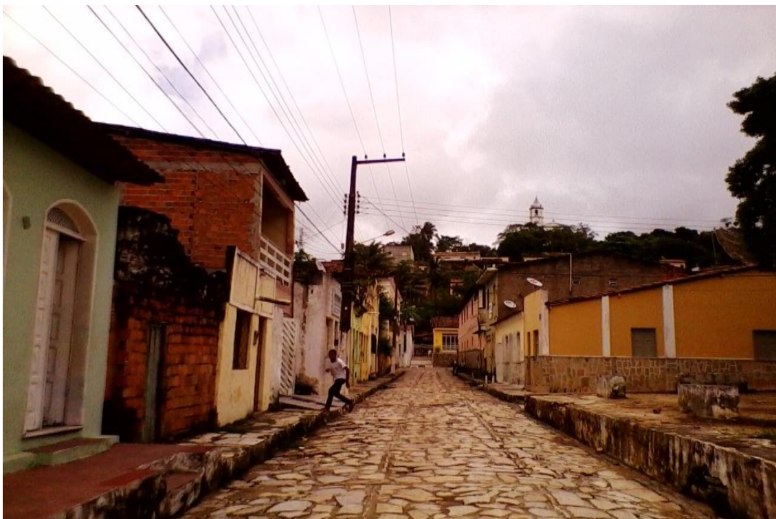
Figura 14: Rua das Pedras de Laranjeiras edificação (Centro da cidade)