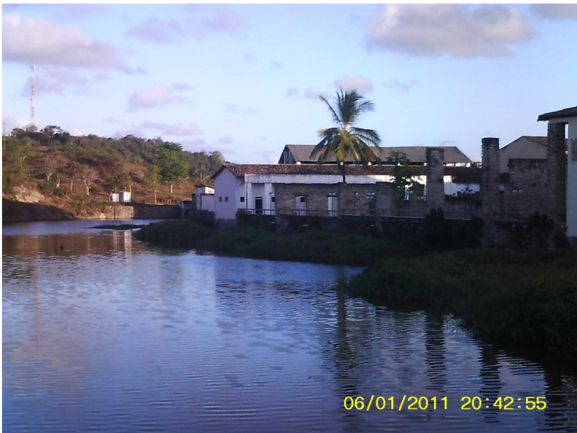
Figura 07 - Margens do Rio Cotinguiba (Fundos da Universidade Federal de Sergipe – UFS)