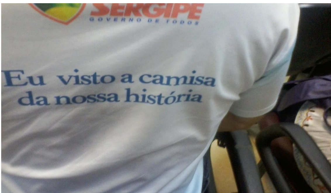
Figura7: "Eu visto a camisa"

Entendemos que o termo tradição não implica recusa à mudança, da mesma forma que a modernização não exige a extinção das tradições. A questão é que a narrativa da modernidade se produz como oposição a tradição como uma superação. Empiricamente vamos percebendo que elas são imbricadas, especialmente no que se refere aos grupos do município Laranjeiras.