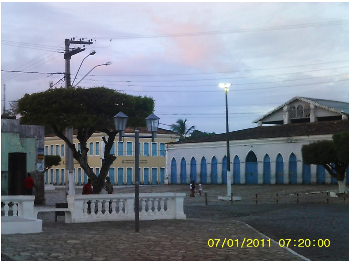
Figura 03: Vista do centro da cidade de Laranjeiras