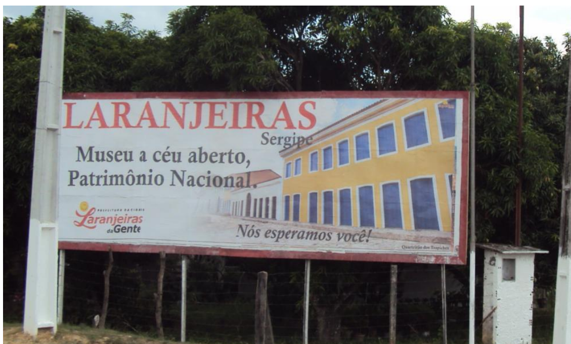
Figura 5: Laranjeiras Museu a Céu Aberto"

Esta fala do prefeito nos aponta uma chave no que diz respeito à memória e para disputa por sua produção e manutenção na cidade. Sabendo que este elemento, a memória é algo significativo no município de Laranjeiras, estariam de um lado os mestres e suas manifestações vivas e do outro lado o poder público, na figura de seus agentes, voltados para as políticas públicas de fomento destinadas a cultura e ao turismo, visando à possibilidade de captação de verbas através destas rubricas de fomento (formas de captação de recursos). A gerência desta memória vem garantindo e mantendo o Encontro Cultural que no ano de 2015 contará com sua quadragésima edição. O IPHAN e a Universidade Federal de Sergipe seguem na manutenção e produção desta memória, apoiando estudos, criando ações de educação patrimonial, sediando eventos ligados ao tema patrimônio material e imaterial. Por fim, todos os atores deste conjunto estão implicados em um só objetivo: o fomento da cultura do município, que faça valer o título da cidade “Cidade museu a céu aberto – Capital da cultura popular.”