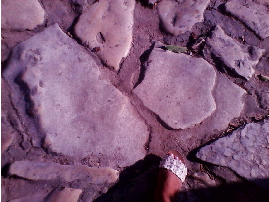
Figura 16: Calçamento "Rua das Pedras"