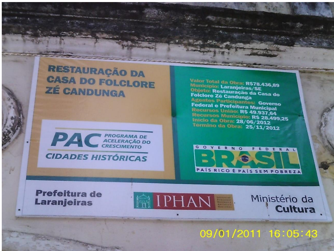
Figura 08: “Restauro” e parcerias- na Casa do Mestre Zé Candunga