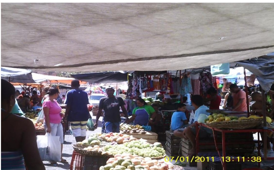
Figura 15: Feira de Laranjeiras (Centro da Cidade) -Centro da Feira - Manhã de Sábado"