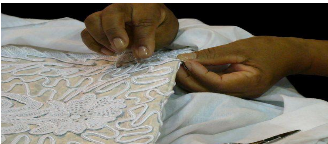
Figura 9: O fazer da Renda Irlandesa

No que se refere ao registro definitivo nos livros do IPHAN sobre bens imateriais, o único registro de fato é sobre a Renda Irlandesa. Outros bens ligados a imaterialidade presentes em Laranjeiras foram catalogados pelo IPHAN em 2011. Alguns destes bens tiveram sugeridos seus registros definitivos nos livros do IPHAN.