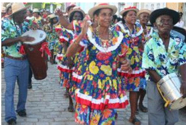
Figura 4: Samba de Pareia da Mussuca