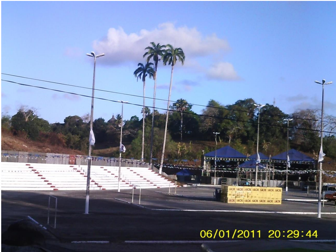
Figura 06: Praça de Eventos, centro da cidade de Laranjeiras