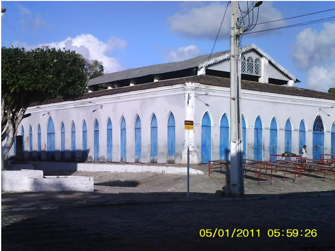
Figura 02: Mercado Municipal