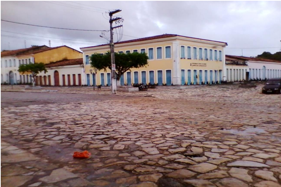
Figura 20: Campus da UFS em Laranjeiras SE.