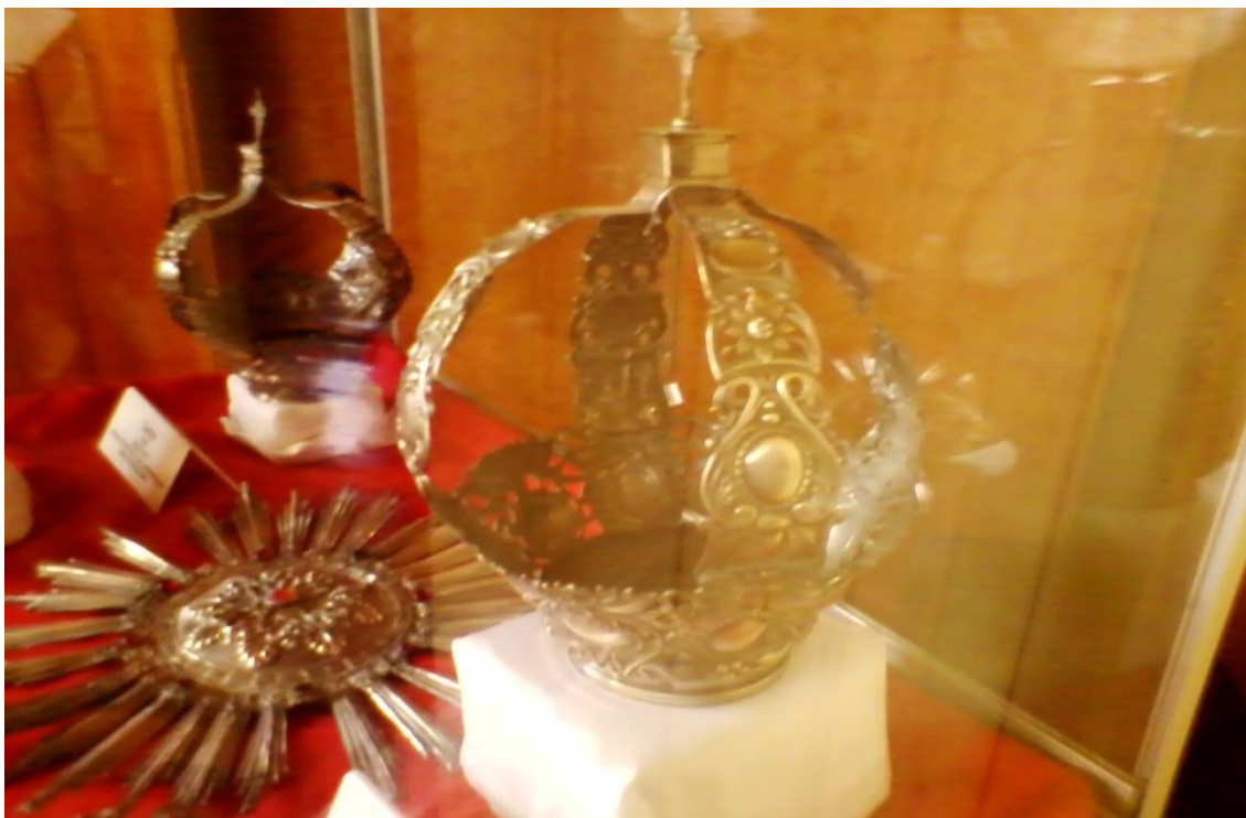
Figura: 8 Coroa e santíssimo - Acervo Museu de Arte Sacra de Laranjeiras

Gonçalves, Centro da cidade. A fundação deste museu data de 1995. Uma casa de arquitetura antiga que serviu como residência dos Francos, uma família tradicional sergipana ligada a história política do estado. Seus cômodos abrigam peças do século XVII, ao século XX. São imagens de santos de vários tamanhos, mobiliário, estandartes, fotos, quadros e objetos de prata. Entre estes objetos de prata há uma coroa que em dias de Encontro Cultural é retirada do acervo do museu, levada até a igreja de São Benedito e colocada na cabeça da imagem de Nossa Senhora do Rosário, onde permanece até a coroação da Rainha das Taieiras. Esta coroa vai “pousar” pelas mãos do pároco da cidade, na cabeça da negra escolhida através do “mistério” (ou indicação dos ancestrais) da irmandade de Santa Barbara Virgem - a Casa de Nagô de Laranjeiras.