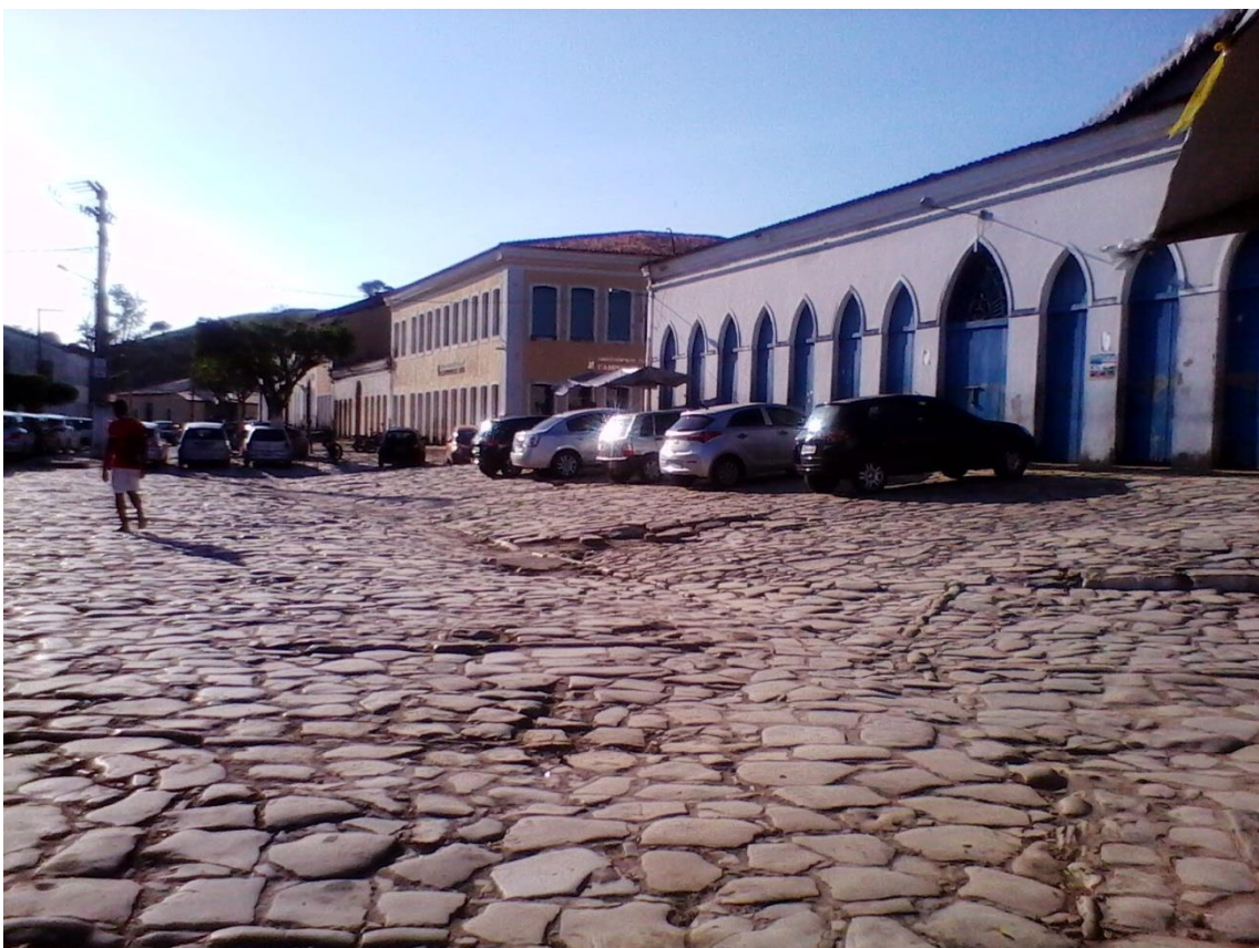
Figura 12 - Calçamento, Centro da Cidade de Laranjeiras