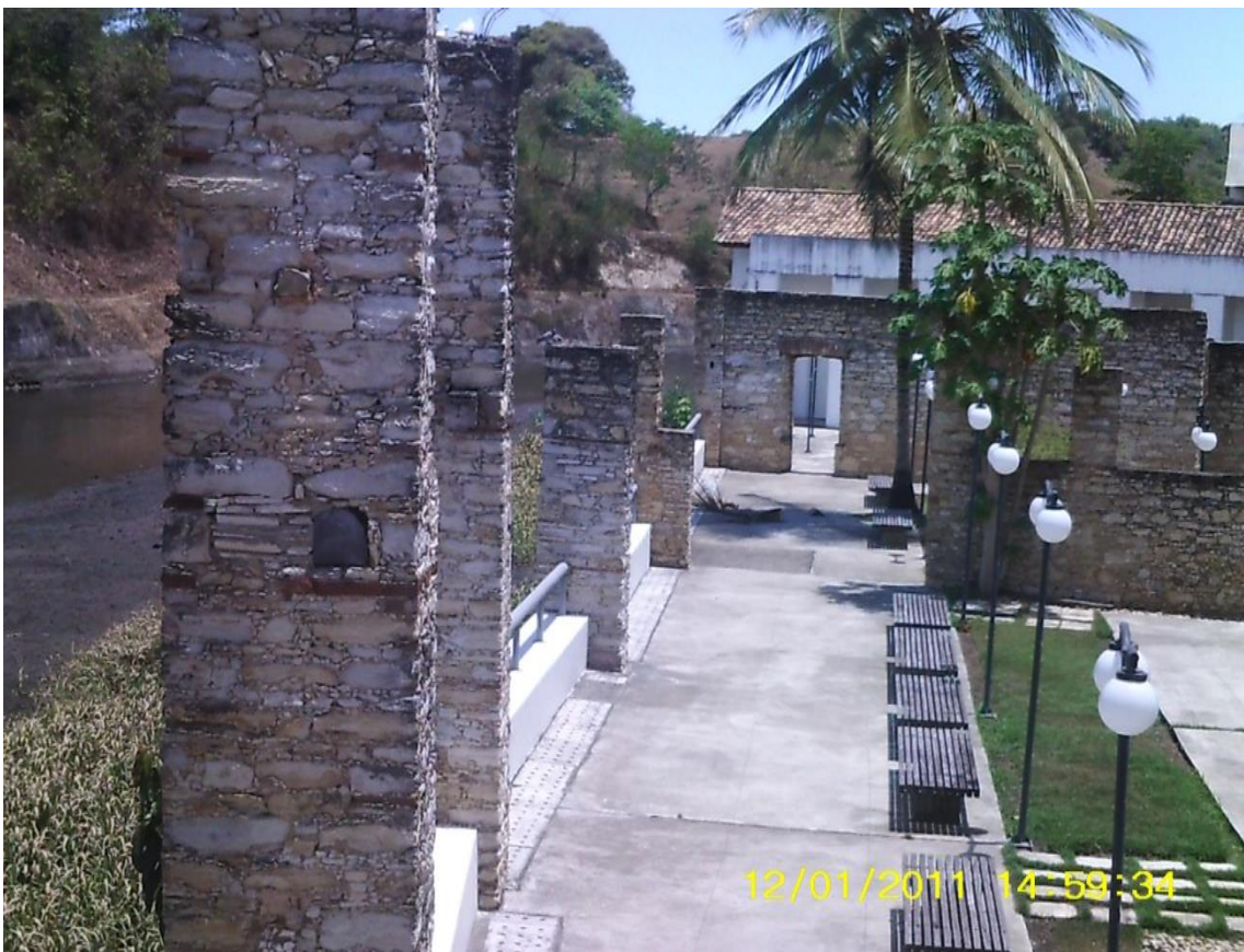
Figura 21: Vista interna do Campus UFS em Laranjeiras.