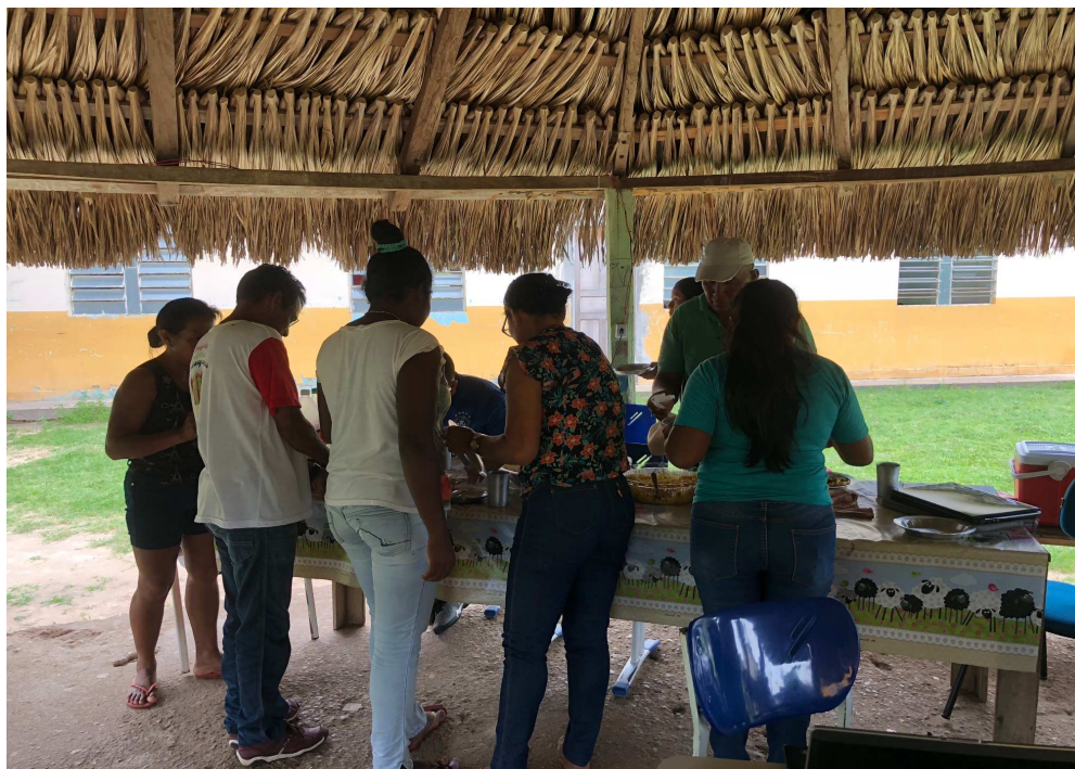
Figura 14 – Almoço coletivo