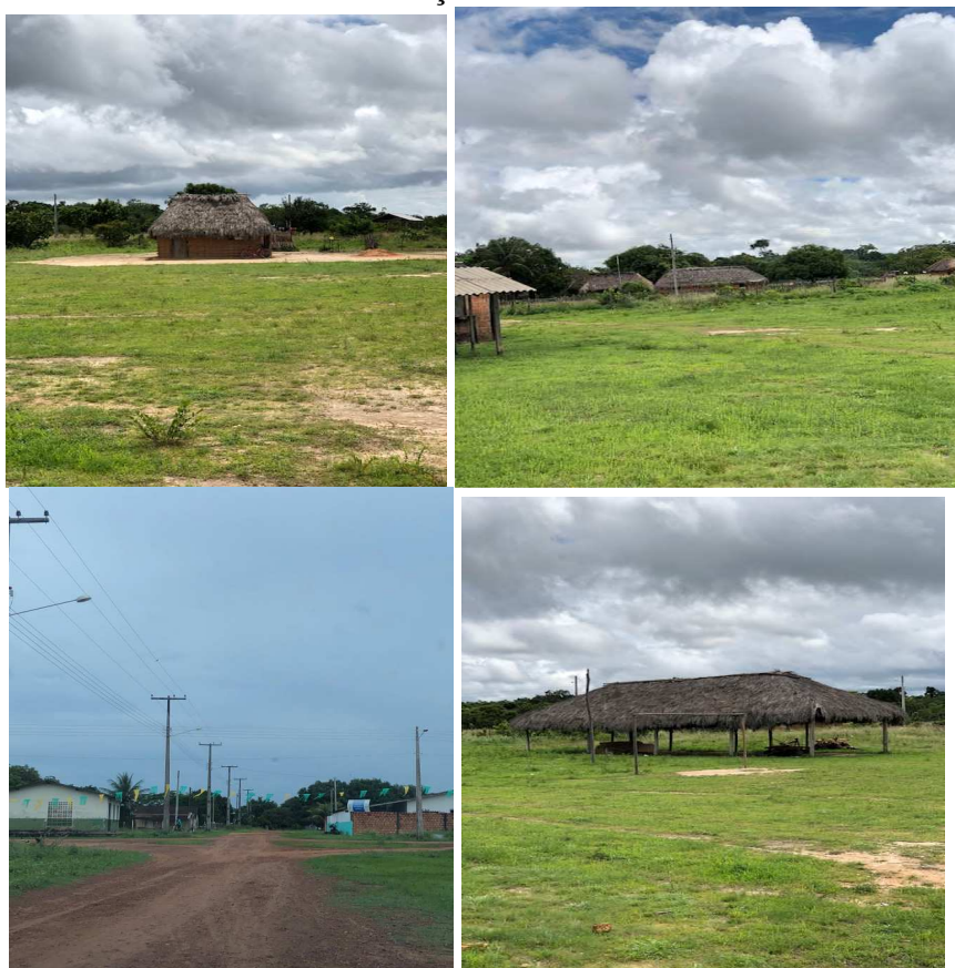
Figura 6 – Residências da Comunidade Araçá