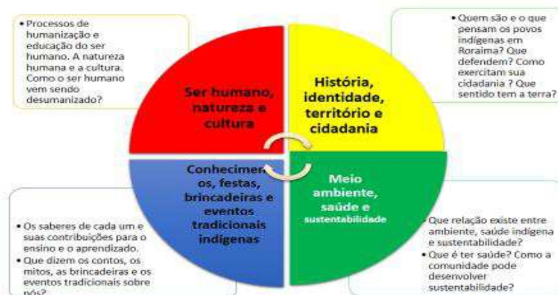
Figura 3 – Fluxograma exemplo de contexto cultural e conhecimentos vinculados