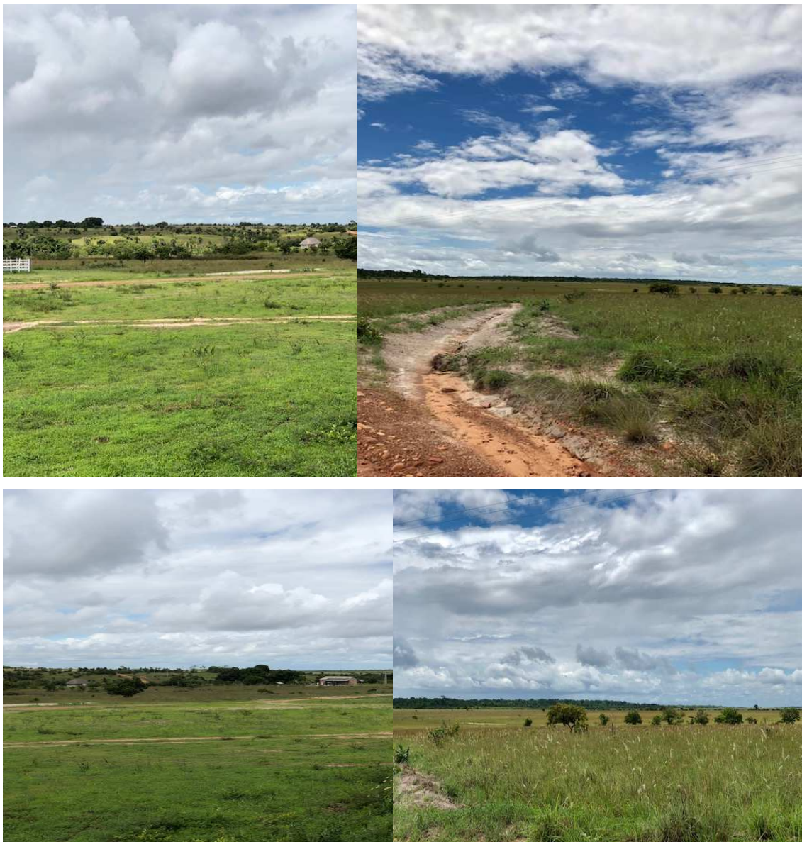
Figura 5 – Região da Comunidade Araçá

Na comunidade, existem roças e fazendas com plantio de árvores frutíferas e leguminosas, que pertencem aos moradores. Há também criação de gado e de peixe. Uma boa parcela da comunidade reside próximo à escola. Algumas residências têm paredes de barro e são cobertas com palhas de buriti (palmeira típica do lavrado roraimense); outras são de concreto e cobertas de telhas (FIGURAS 5 e 6).