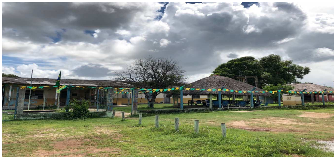
Figura 8 – Escola Estadual Indígena Tuxaua Raimundo Tenente

Conforme se percebe no quadro 1, a escola oferta todos os níveis de ensino da educação básica. Com isso, as crianças e os jovens não saem da comunidade para estudar. Permanecem na comunidade e em contato permanente com sua cultura.