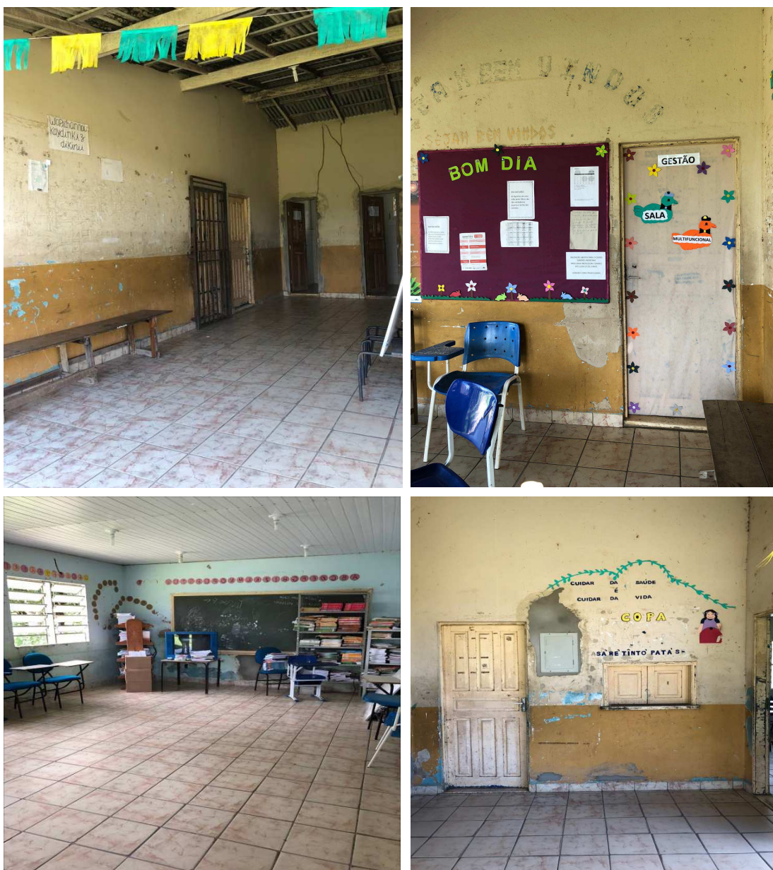
Figura 9 – Estrutura física da escola

Em sua estrutura física, a unidade de ensino conta com 5 salas de aula, 1 funcionando provisoriamente como biblioteca e sala de informática. A escola não dispõe ainda de um laboratório de informática com instalações adequadas. No entanto, tem 1 sala de aula que também é usada como laboratório de informática, além de ser utilizada para atividades pedagógicas com o emprego de vídeos. Além disso, tem 1 sala de direção que funciona como secretaria, coordenação pedagógica, secretaria e sala multifuncional e 2 banheiros, sem adaptação para pessoas com necessidades educacionais específicas. E, conforme dito anteriormente, dispõe de 1 malocção que é utilizado como sala de aula (FIGURA 9).