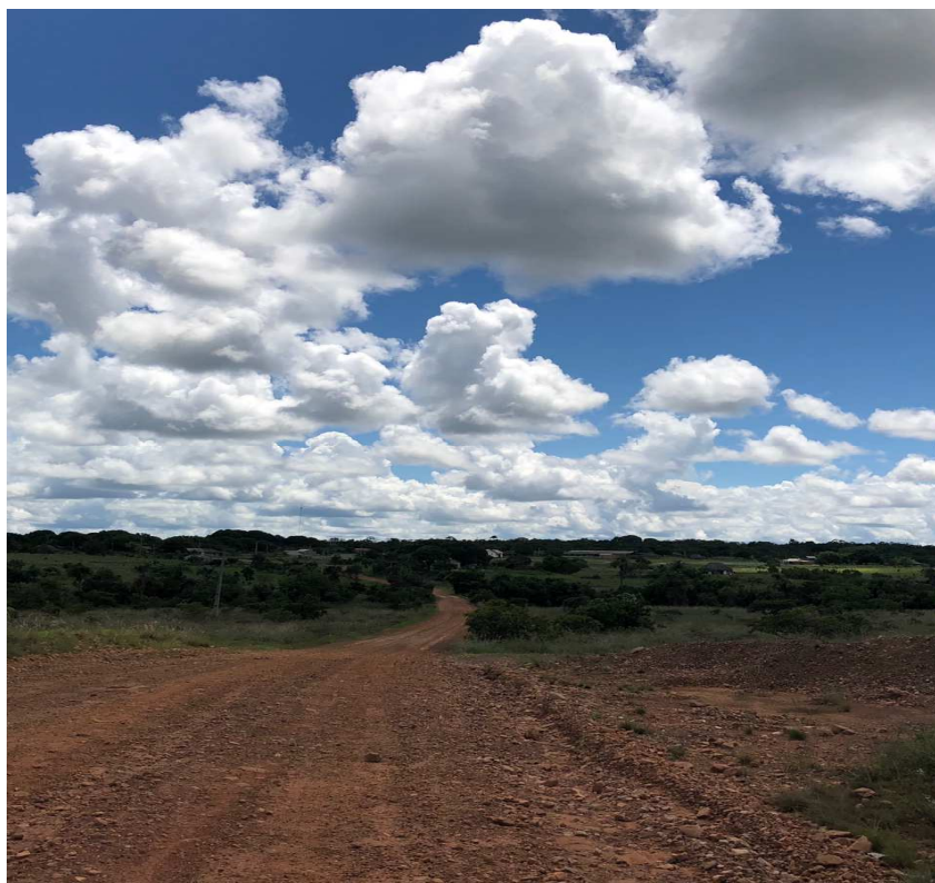
Figura 7 – Estrada que dá acesso à Comunidade Indígena Araçá