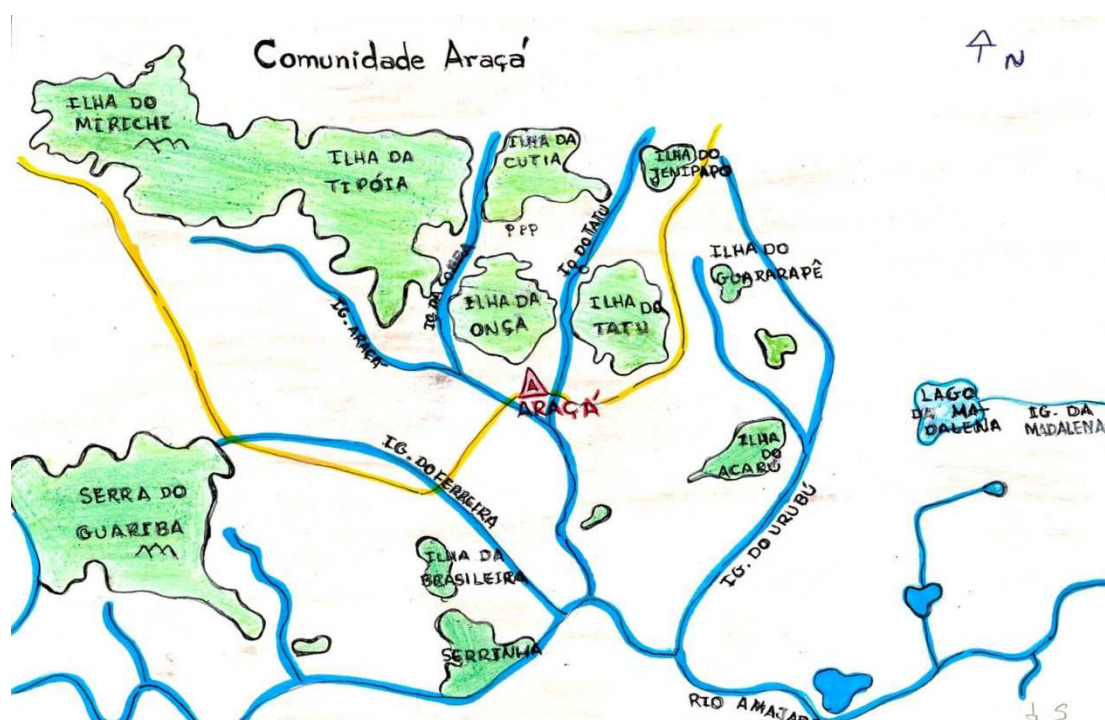
Figura 4 – Mapa da Comunidade Indígena Araçá feito pelo estudante da Escola Estadual Indígena Tuxaua Raimundo Tenente

A comunidade é habitada por 431 pessoas: indígenas das etnias Wapichana, Makuxi, Taurepang e Sapará, e não indígenas. É composta por 104 famílias (SESAI, junho 2018). Na Figura 4 temos um desenho da comunidade feito por um estudante da escola Tuxaua Raimundo Tenente.