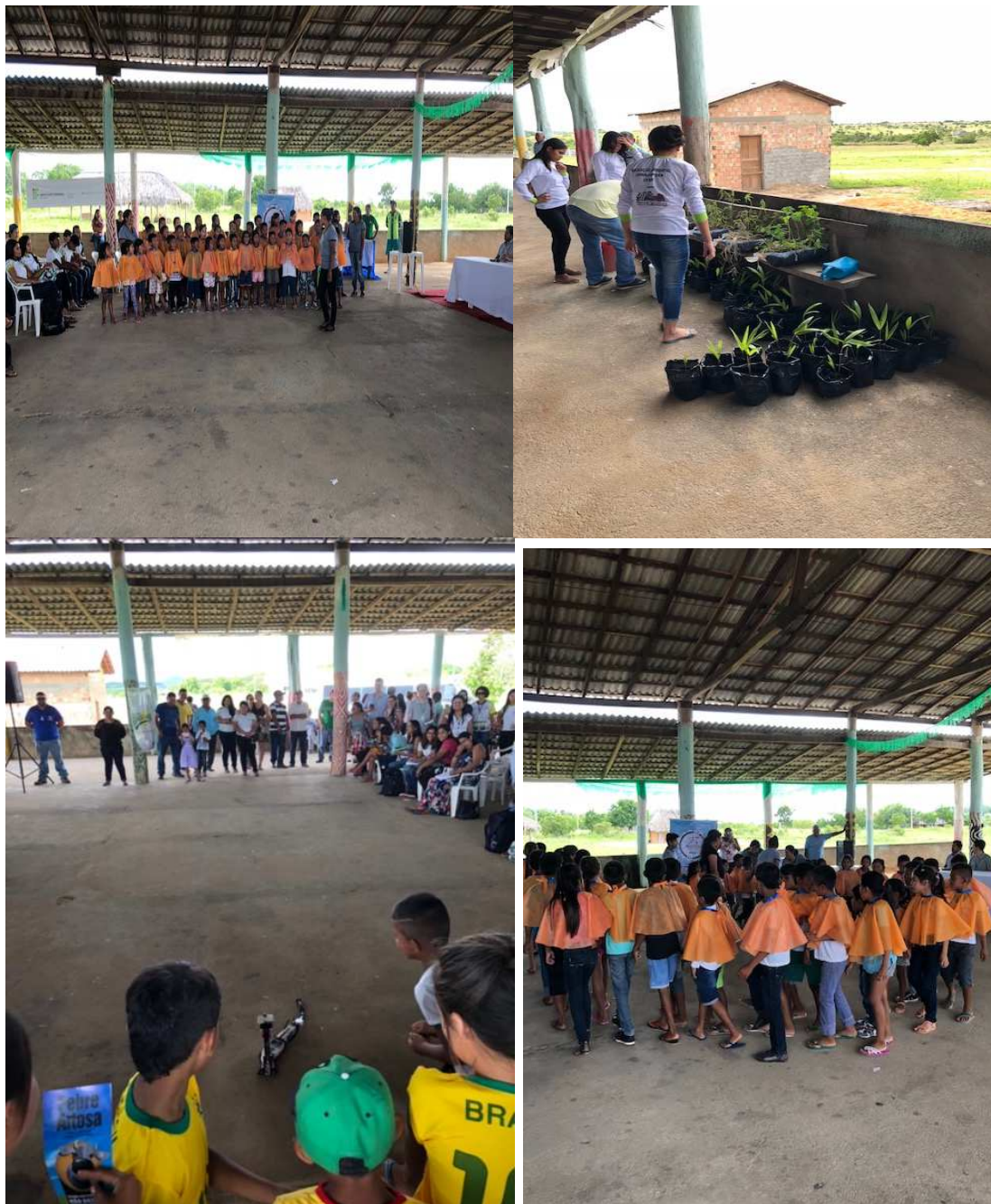
Figura 16 – Atividades desenvolvidas no IF Comunidade