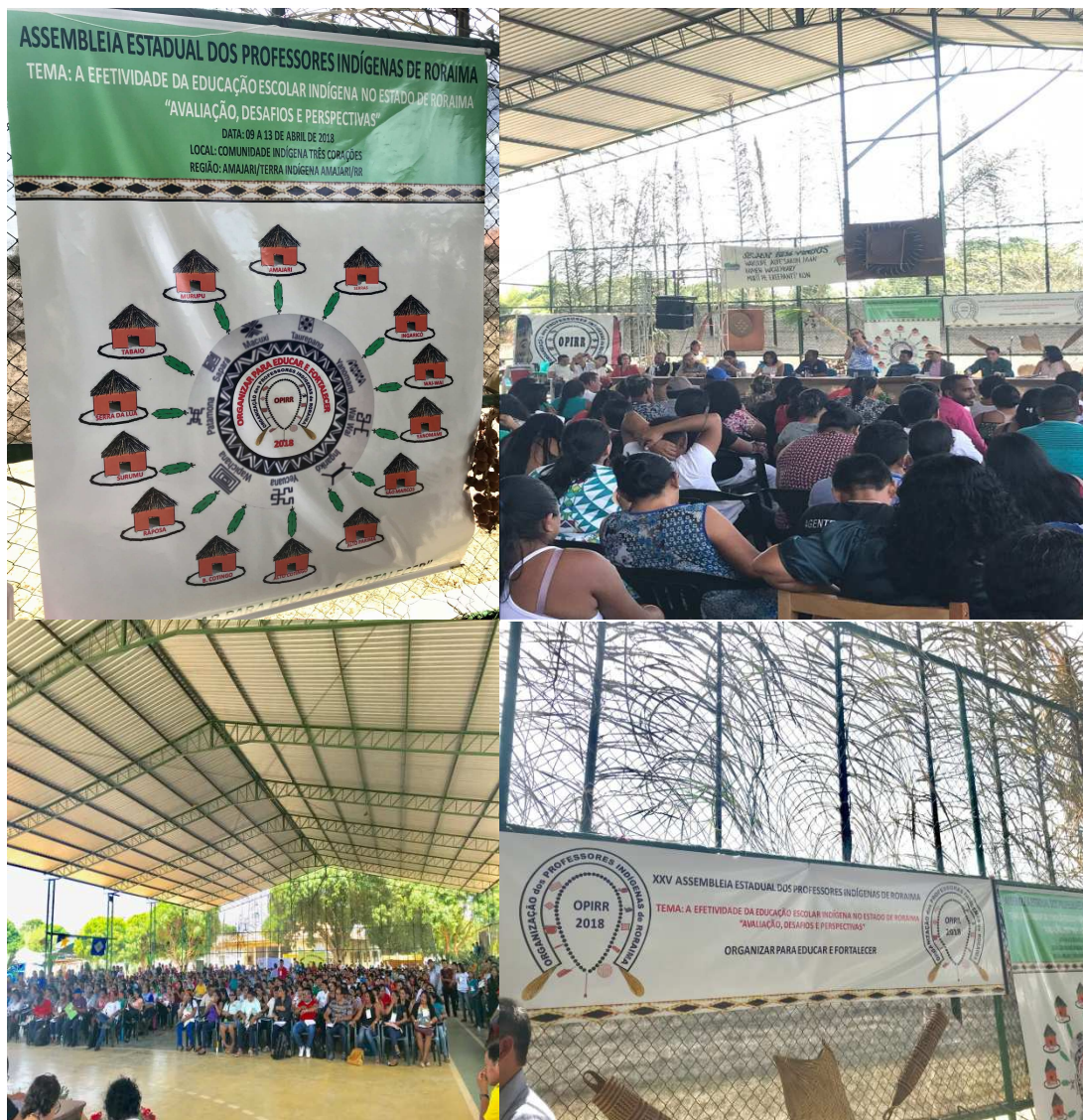
Figura 15 – XXV Assembleia Estadual dos Professores Indígenas de Roraima (Opirr)

Foram recorrentes as discussões sobre transporte, merenda, material didático apropriado para as escolas indígenas, construção, reforma e ampliação das escolas indígenas. Durante toda a assembleia, a comunidade foi conclamada a se fazer cada vez mais presente nos debates. Questões envolvendo o PPP foram bastante salientadas na assembleia, o que constata o anseio de as escolas indígenas terem o documento aprovado.