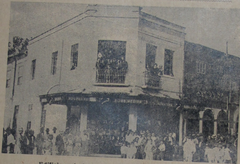
Edificio onde foi installada a "Alfaiataria GLOBO"

Inauguraram-se no dia 4 do corrente á rua Marechal Floriano, 384 as novas e modernas installações da filial da popular Alfaiataria Globo, desta cidade.