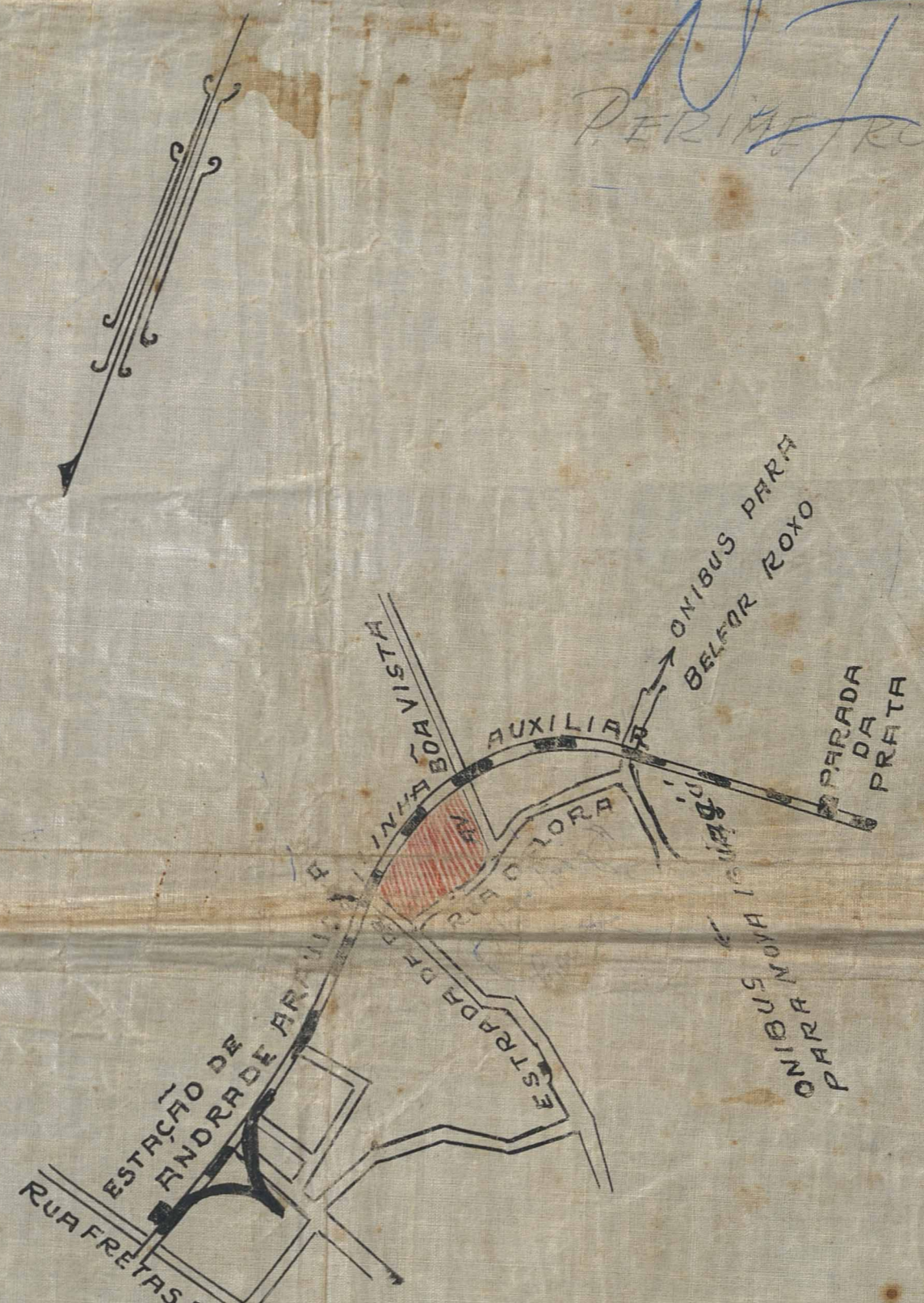
SITUAÇÃO ESCALA 1-10000