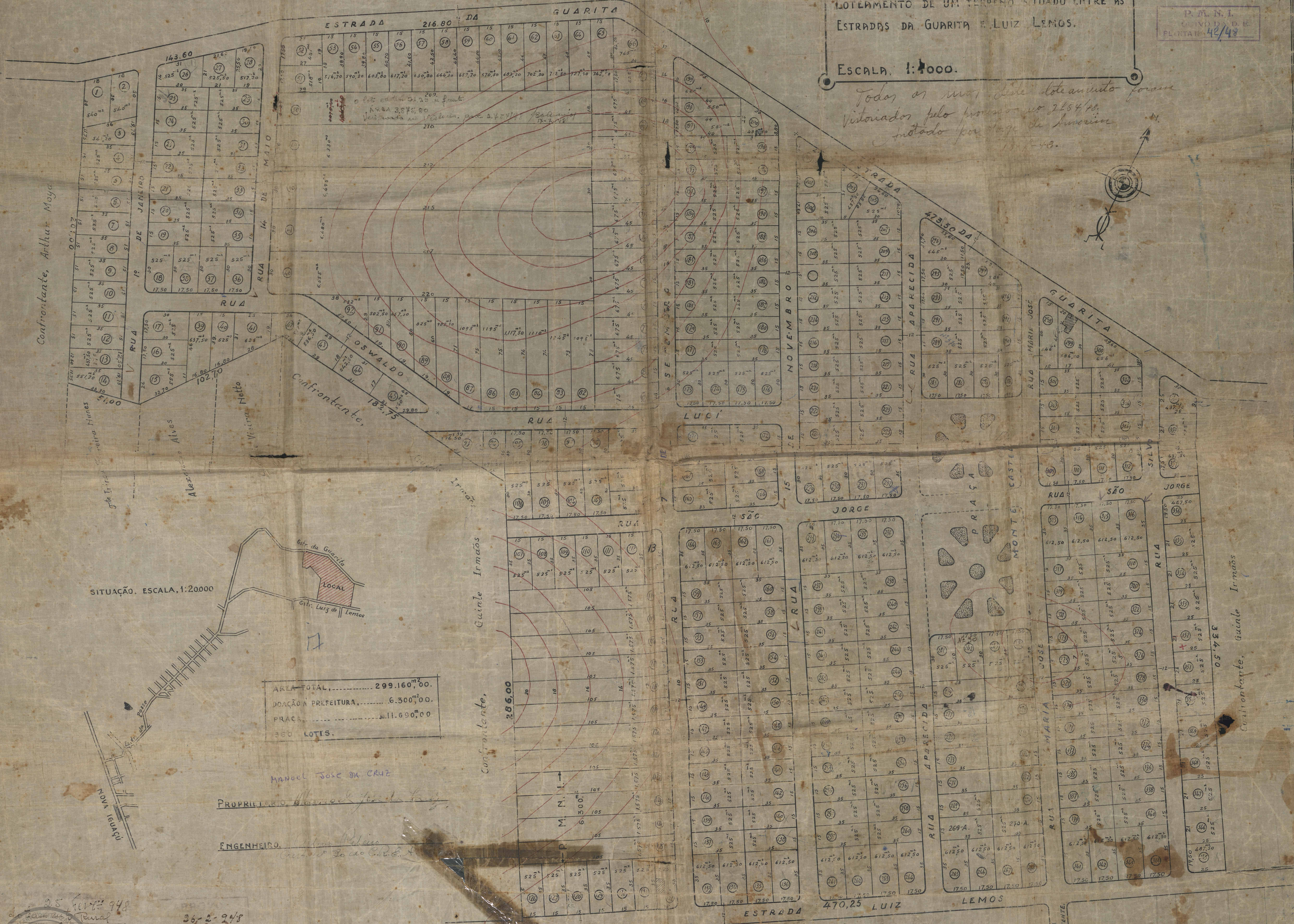
SITUAÇÃO. ESCALA: 1:20000