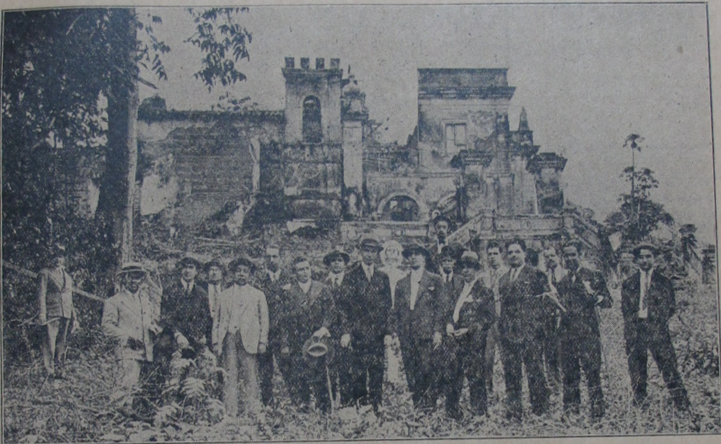
Secular residencia da Marqueza de Santos, em Sarapuhy -- Grupo de excursionistas

Realizou-se no dia 24 do mez p. findo, a convite do sr. Prefeito do Municipio, linda excursão de inspecção á nova estrada de rodagem ligando Belford Roxo a rodovia Rio-Petropolis. Nesse dia o sr. Prefeito em companhia de numerosos convidados, deixou esta cidade, ás 9 horas da manhã, seguindo os de sua comitiva em cinco automoveis, em demanda da localidade de Belford Roxo.