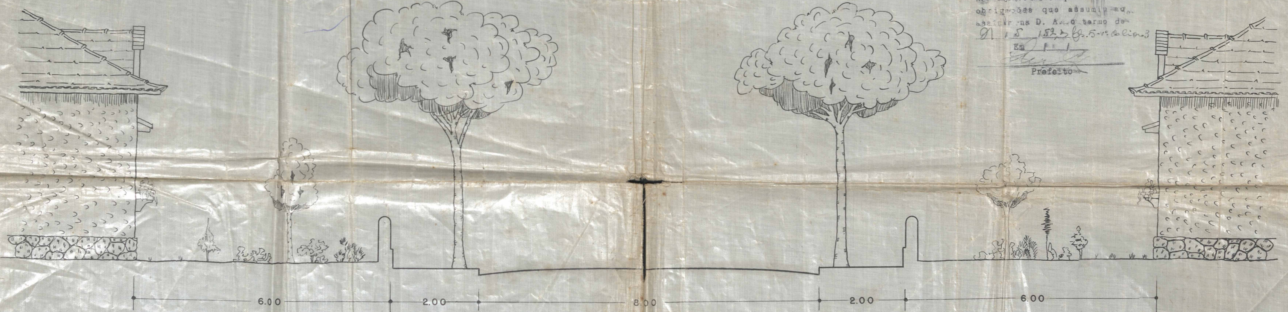
SECÇÃO TIPICA DAS RUAS ESCALA = 1:50

APROVADO, sujeitando-se o proponente ao cumprimento das obrigações que assumiu no assessoria D. A. do termo de D. 1.5. 152, de 19.5.52 de 1953 Em 1.5. 1952 Prefeito