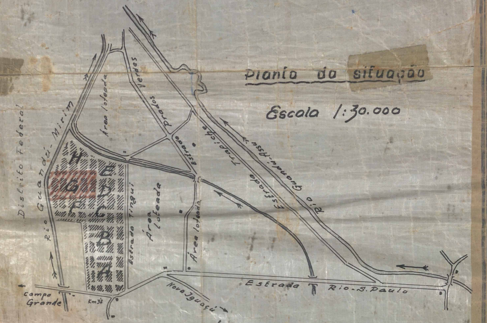
planta da situação