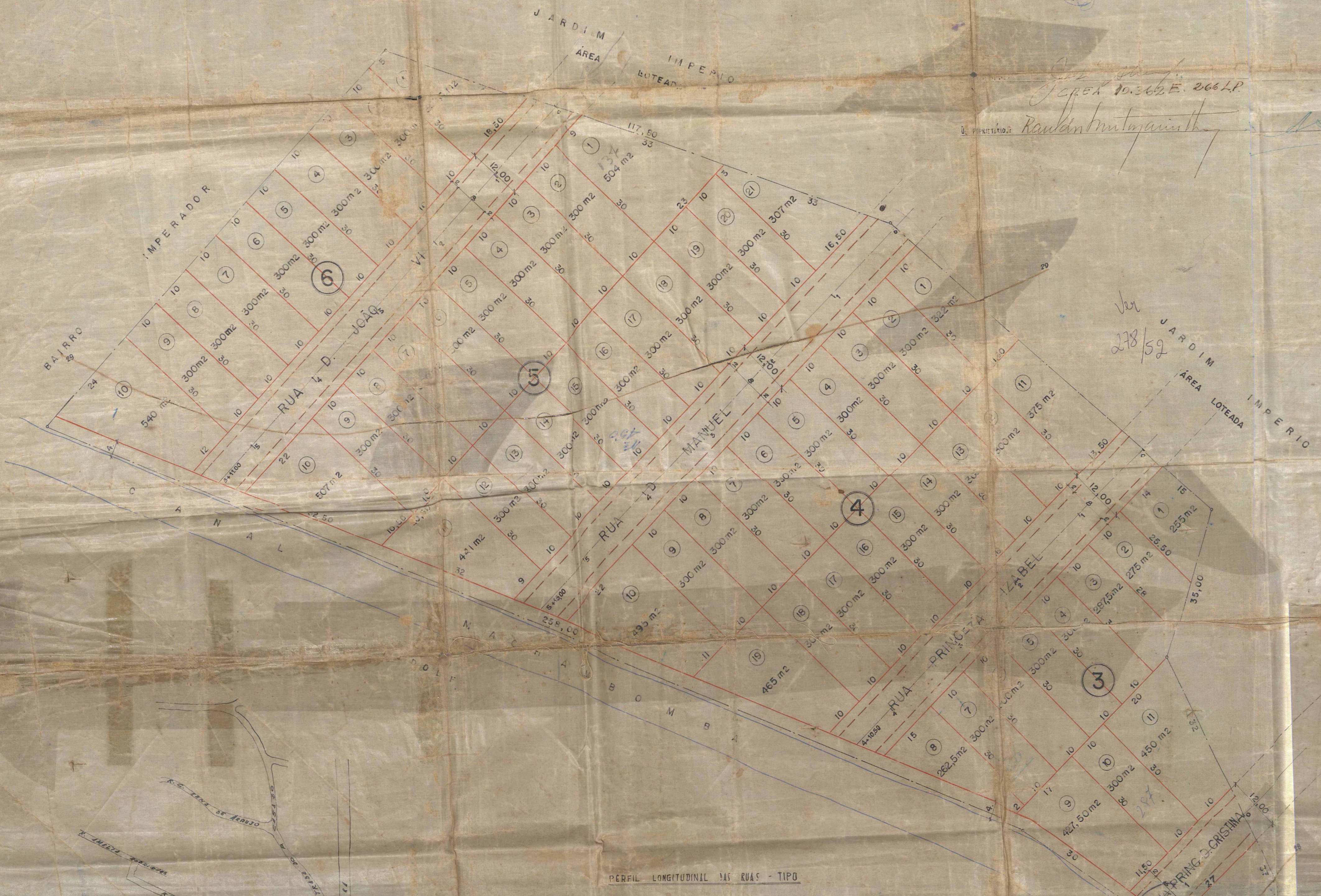
PERFIL LONGITUDINAL DAS RUAS - TIPO