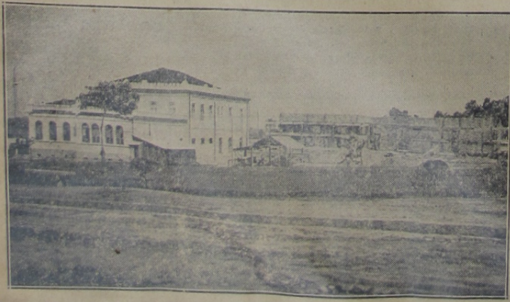
Vista parcial e antiga da praça João Pessoa, vendo-se o Forum e, ao fundo, o Hospital de Iguassu, quando ainda em construção

AS razões da mulher são sempre mais fortes e, pelo menos, mais originaes que as dos homens, que em todas as difficuldades, appellam para a privação dos sentidos.