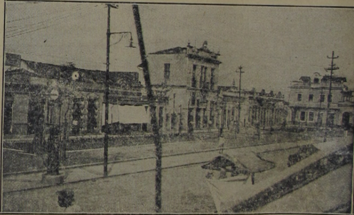
Aspecto antigo da praça Ministro Seabra, hoje completamente remodelada e modernizada, pela actual administração

A FELICIDADE vem de subito, a prosperidade pouco a pouco. Esta é o fruto do trabalho, aquella do capricho da sorte. —Camillo Castello Branco.