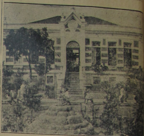
Fachada do edificio onde funciona a Prefeitura Municipal de Iguassu

Polpa de Tamarindos para refrescos e sorvetes de Abreu Sobrinho