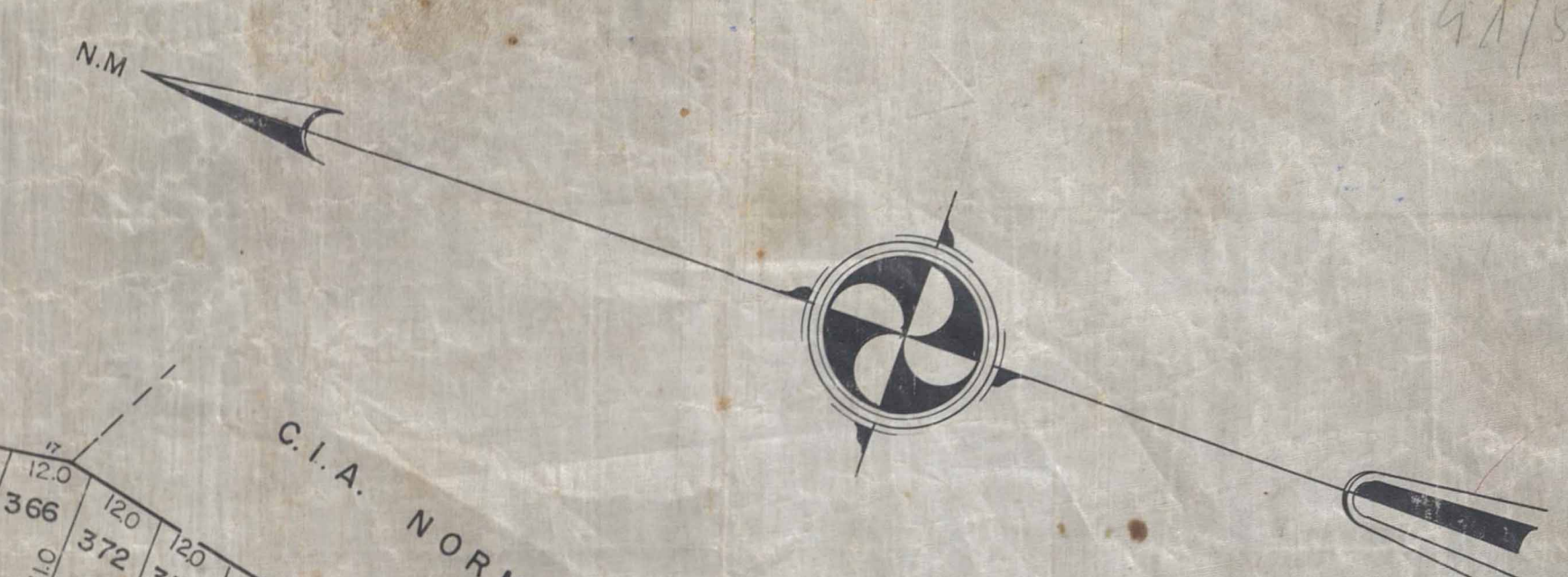
PLANTA DE SITUAÇÃO

ÁREA DOS 621 LOTES = 234 170 m 2 ÁREA DAS RUAS E RECUOS = 56 955 m 2 ÁREA TOTAL = 291 125 m 2