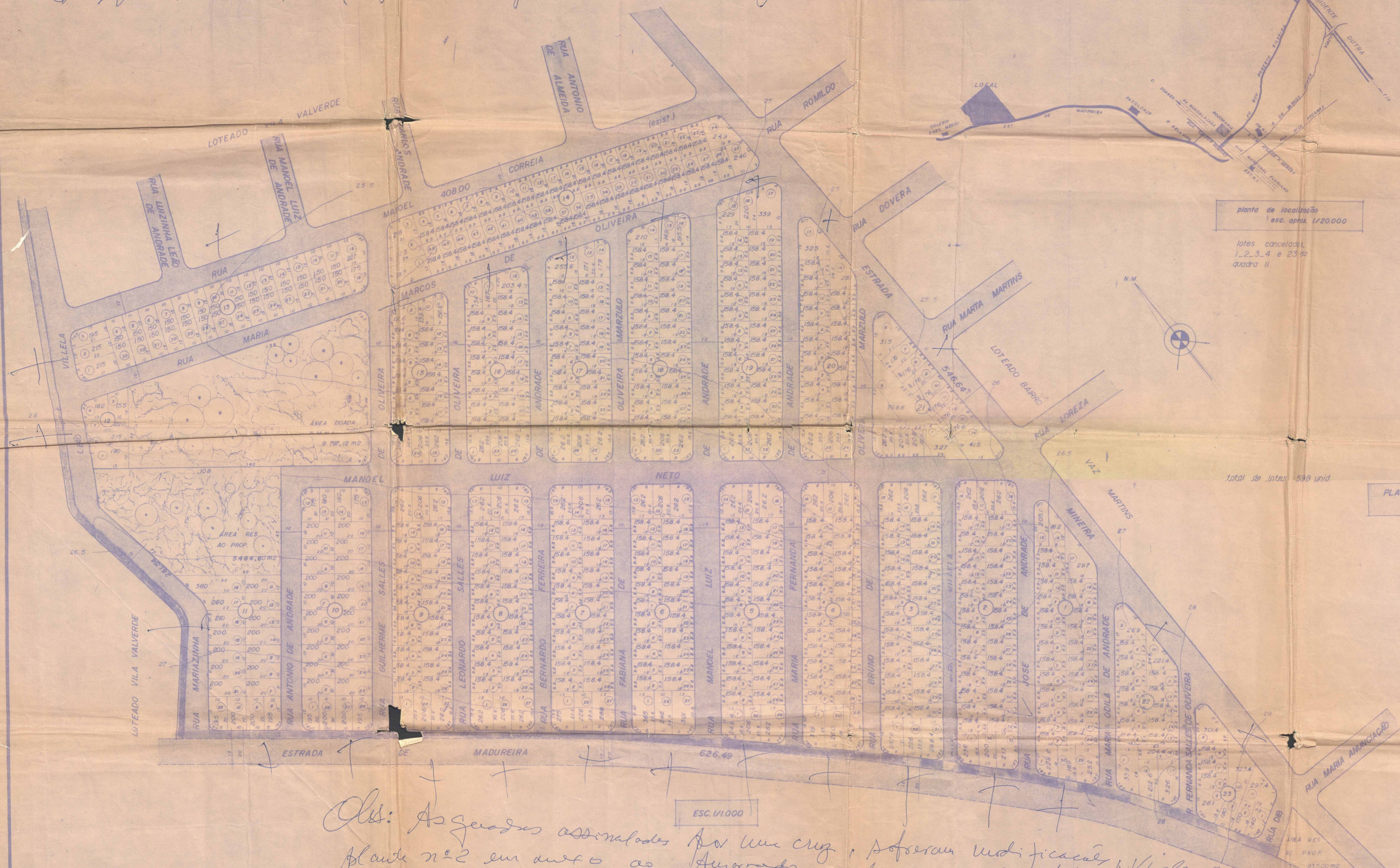
total de lotes 598 unid.

16 Setembro 88 Modificações de loteamento de 517 lotes para 598 lotes 187.140,00 m 2 05/2155/88