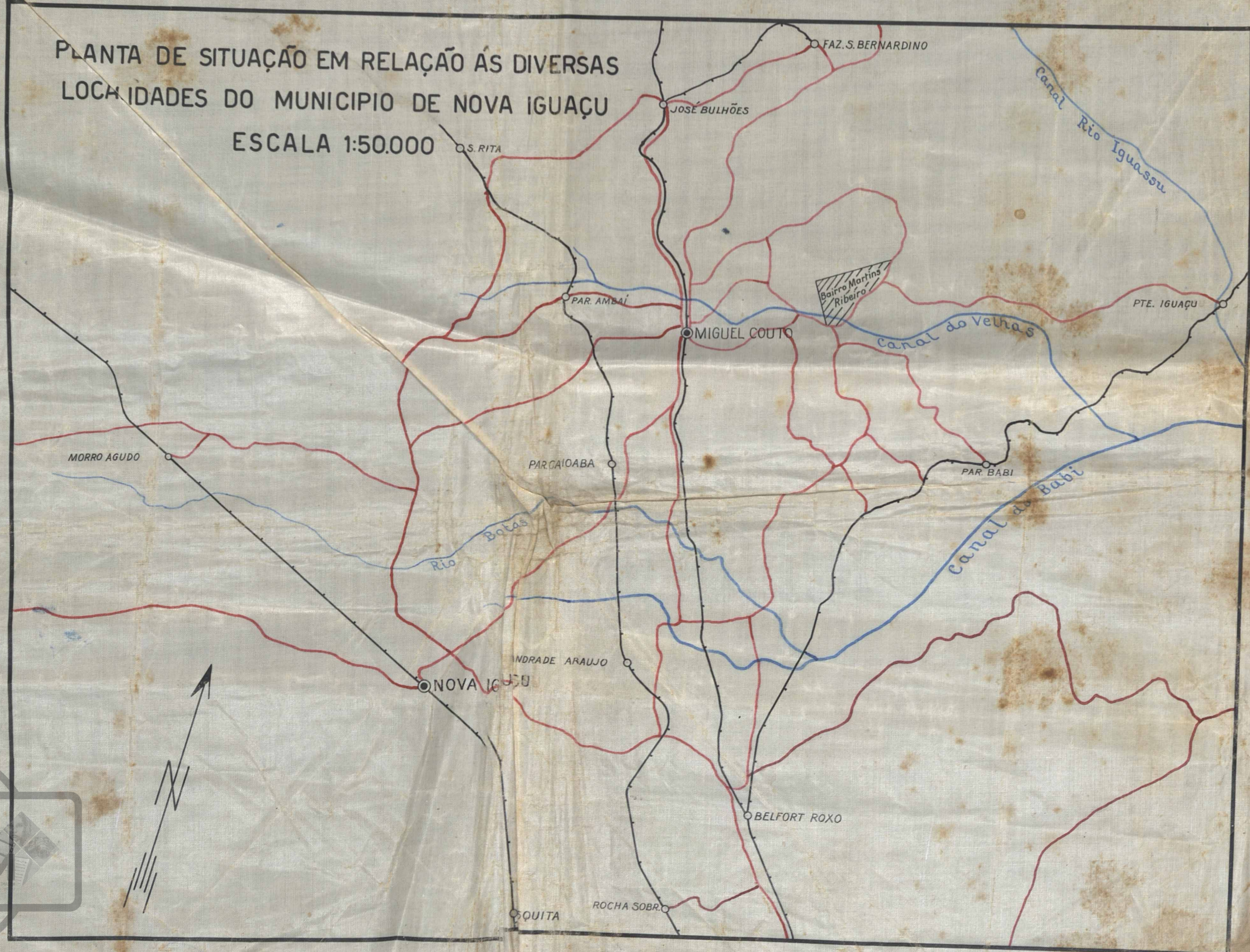
PLANTA DE SITUAÇÃO EM RELAÇÃO ÀS DIVERSAS LOCAIDADES DO MUNICÍPIO DE NOVA IGUAÇU ESCALA 1:50.000